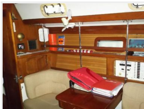
Salon Starboard View