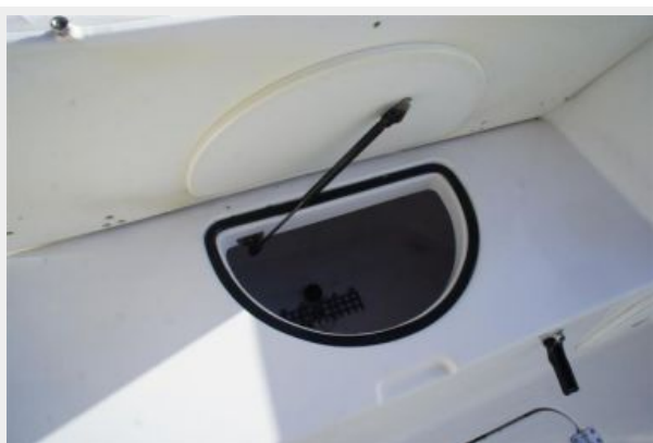
Livewell Under Aft Seat