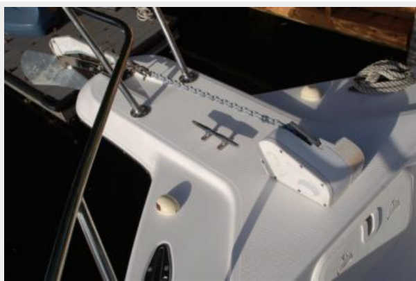
Pulpit and Windlass