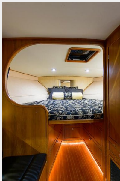
Stateroom Queen Berth