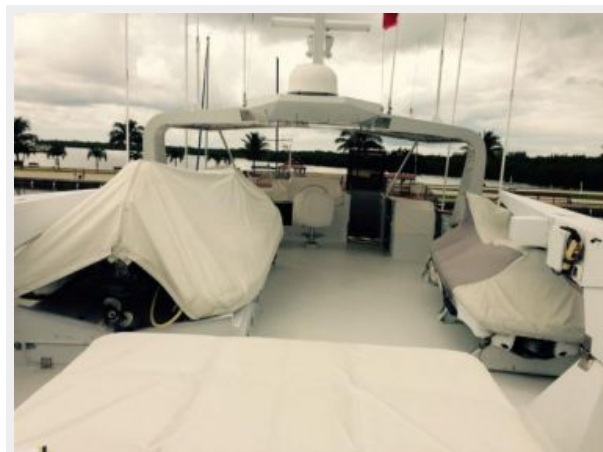
Flybridge looking forward