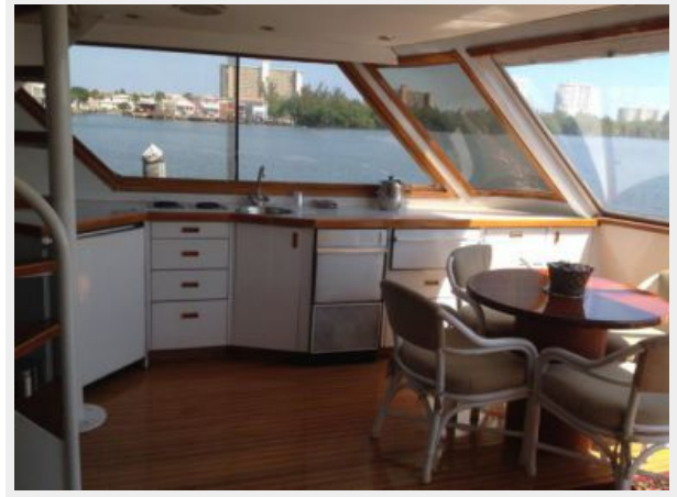
Starboard Side Aft Deck