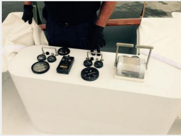
Flybridge Aft Helm