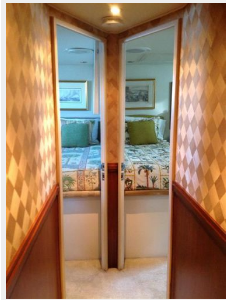
Guest Staterooms looking aft