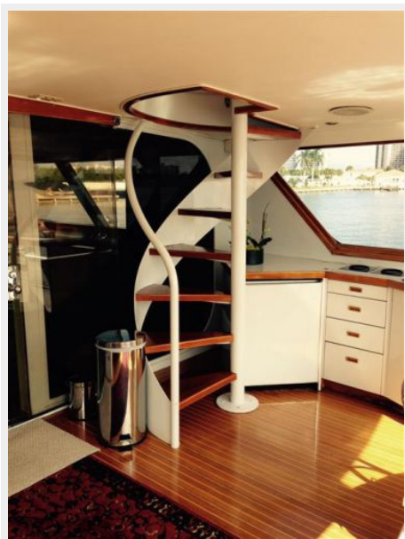
Spiral Staircase to Flybridge