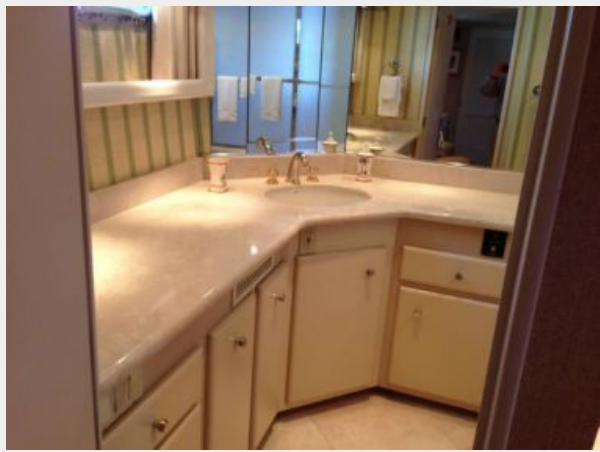
Port Master Stateroom Head