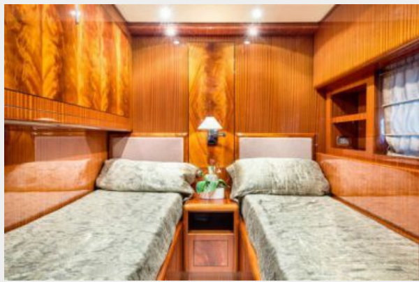
Twin Cabin + Pullman