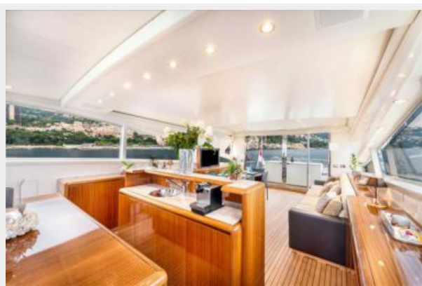
Main Salon & Bar