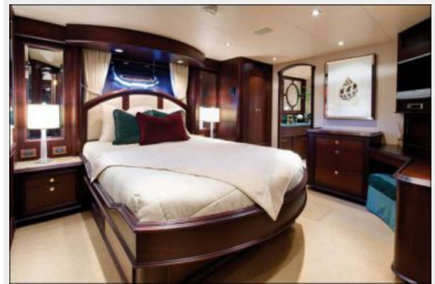
Queen Guest Stateroom