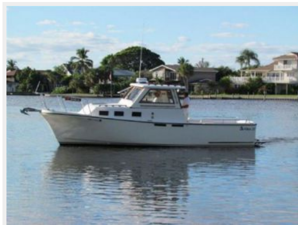
PORT SIDE PROFILE