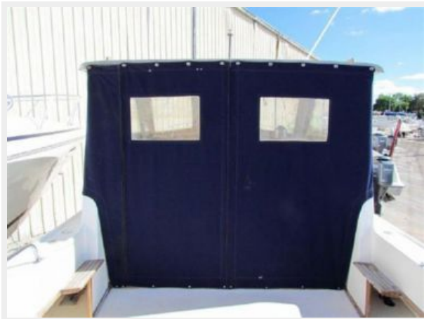
PILOT HOUSE AFT CURTAINS