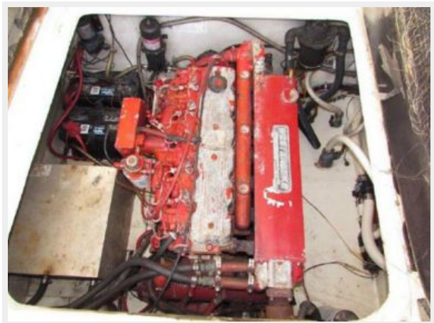
WESTERBEKE 100 HP DIESEL