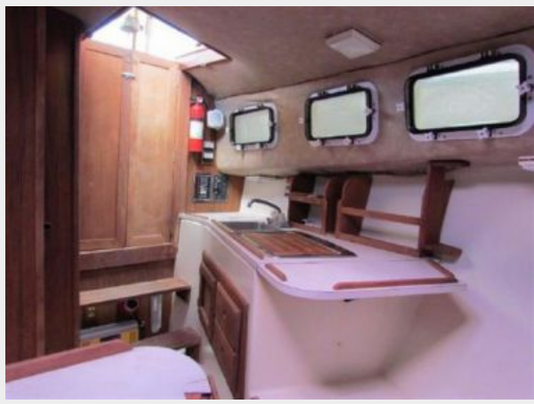
CABIN LOOKING AFT- PORT