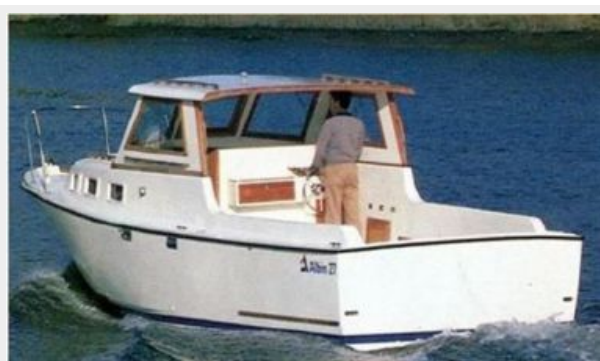
ALBIN 27 SPORT CRUISER