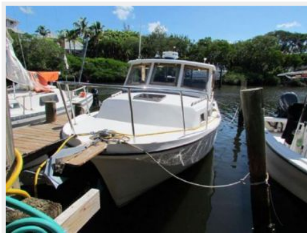
DOCKSIDE, PORT BOW QUARTER