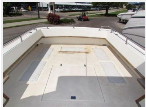
LARGE COCKPIT W/EXCELLENT STORAGE