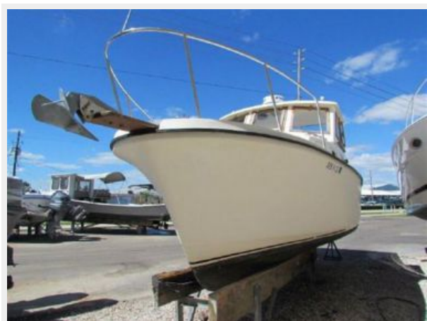
PORT SIDE BOW- HAULED