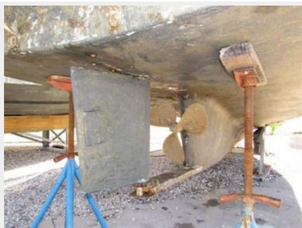
RUDDER 3 BLADE PROP