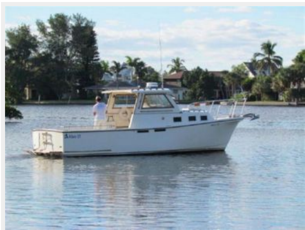
STARBOARD STERN QUARTER