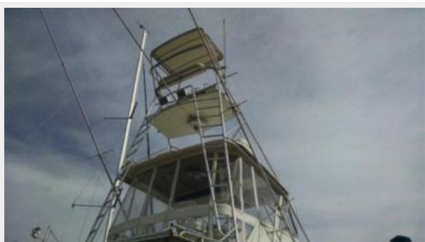
Deck 1 - Tower