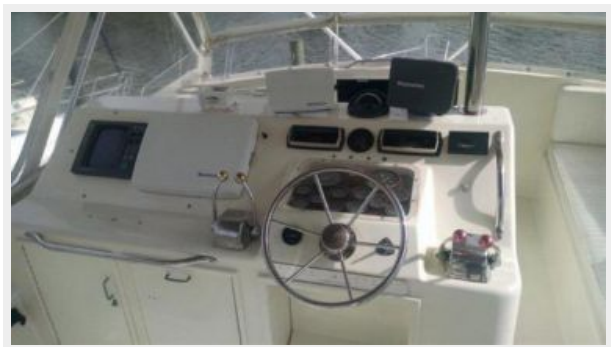
Helm / Electronics & Navigation