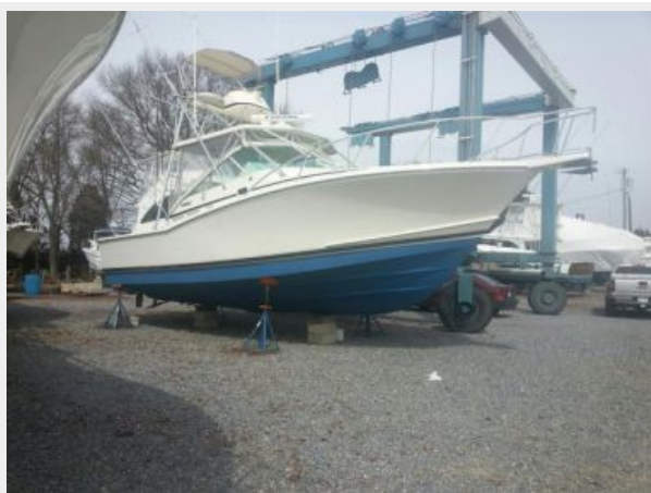
Profile 4 - Starboard