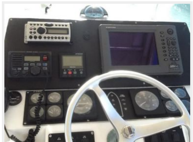
Helm / Electronics & Navigation 2