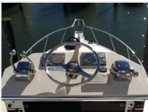
Helm / Electronics & Navigation 3 - Tower Electronics