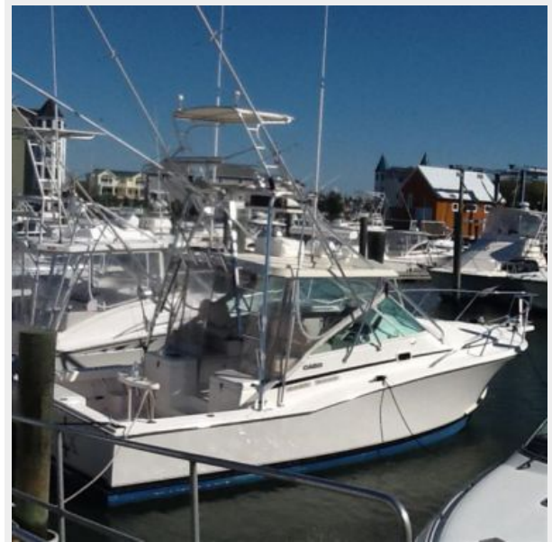
Profile 3 - Starboard