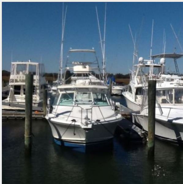
Profile 2 - Bow