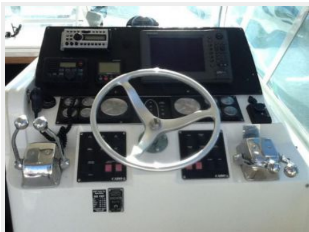
Helm / Electronics & Navigation 1