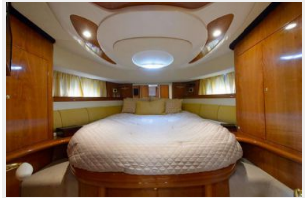
Master Stateroom Head