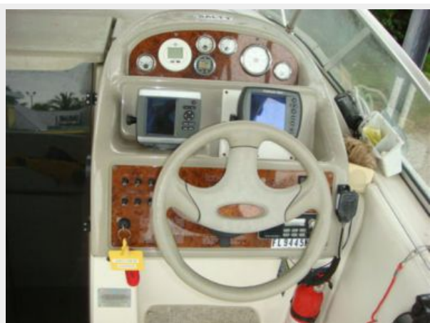
28' Bayliner helm photo2