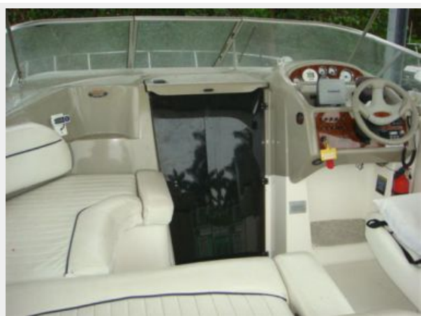
28' Bayliner upper deck forward