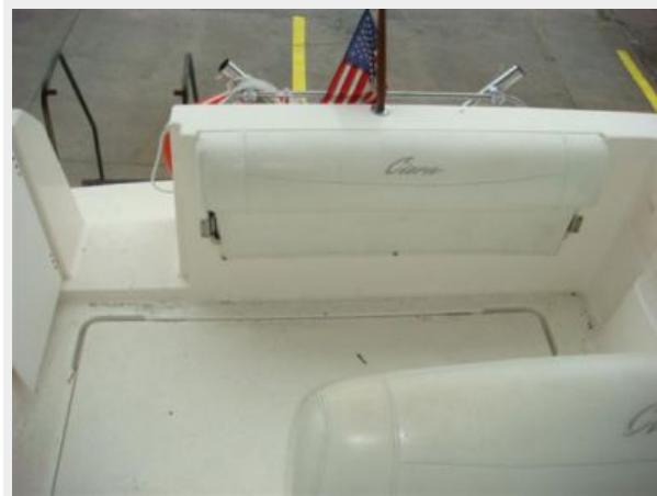
28' Bayliner cockpit forward