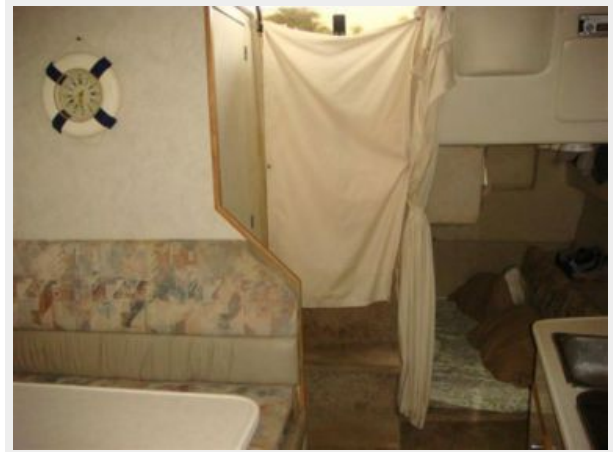
28' Bayliner salon aft