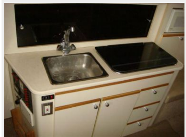
28' Bayliner galley photo2