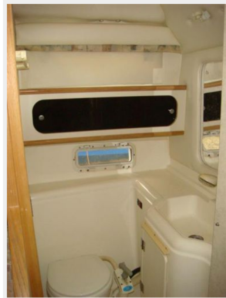
28' Bayliner head