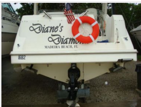
28' Bayliner swimplatform