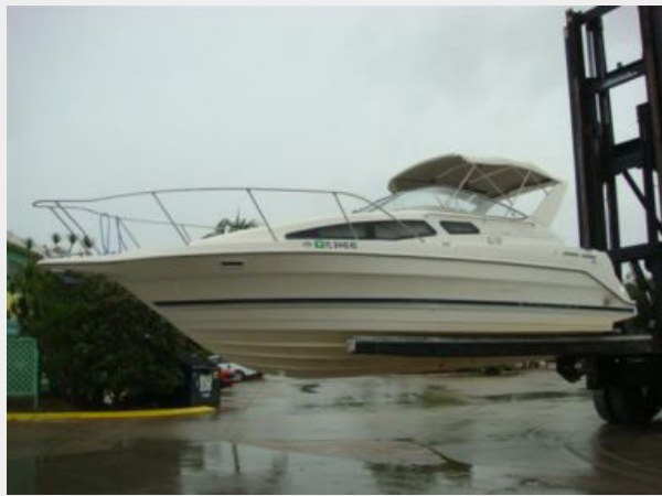
28' Bayliner port profile