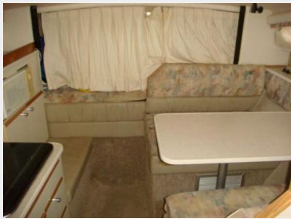
28' Bayliner salon forward