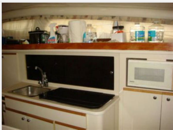
28' Bayliner galley photo1