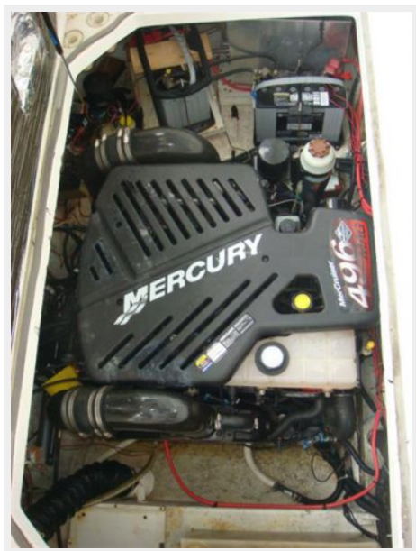
28' Bayliner engine compartment