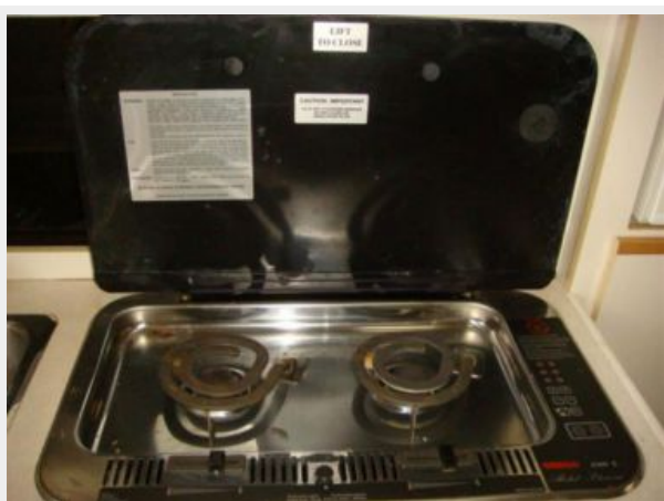
28' Bayliner galley cooktop