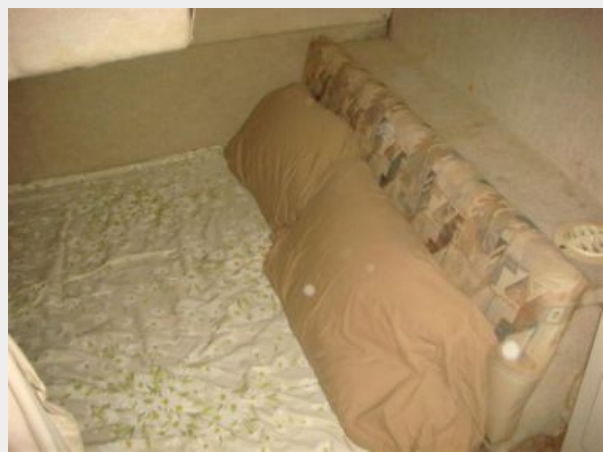
28' Bayliner aft stateroom