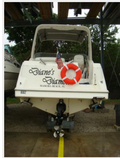
28' Bayliner aft profile