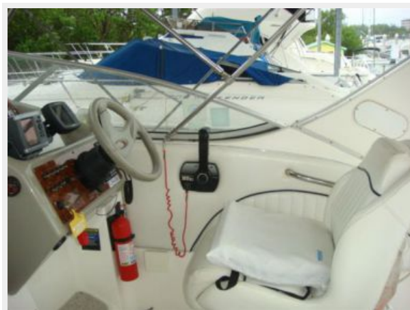
28' Bayliner helm photo1