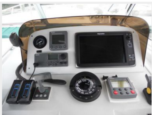
34' Mainship Pilot Express Helm