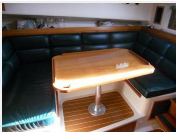
34' Mainship Pilot Express Convertible Dinette