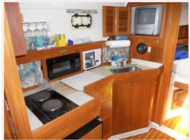
34' Mainship Pilot Express Galley