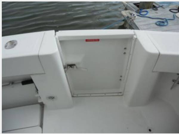
34' Mainship Pilot Express Swim Platform Door