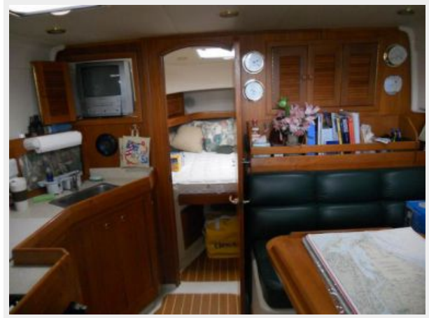
34' Mainship Pilot Express Interior View