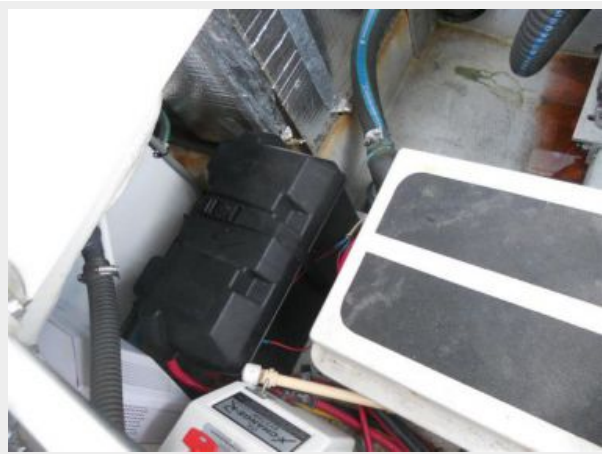
34' Mainship Pilot Express