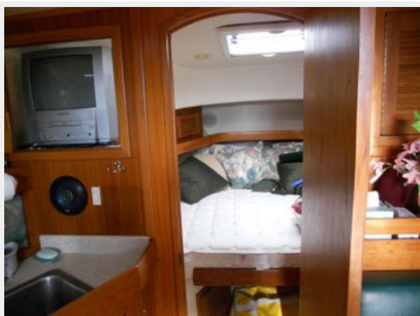
34' Mainship Pilot Express Looking Forward into Cabin