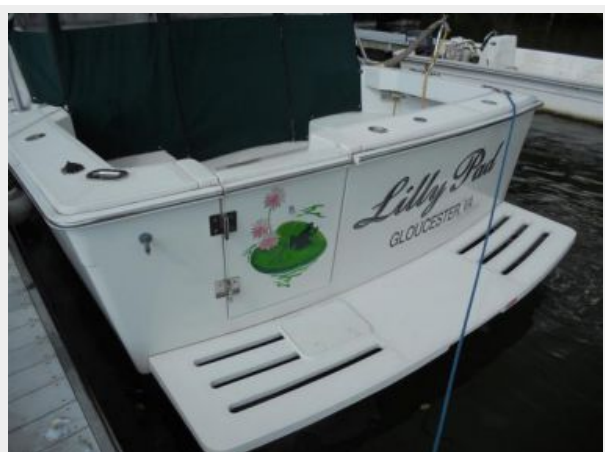
34' Mainship Pilot Express