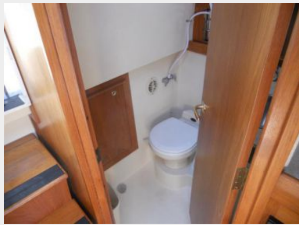
34' Mainship Pilot Express Head