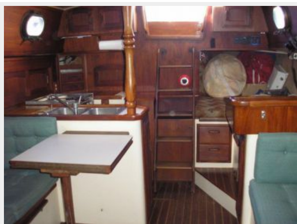
Main Cabin Looking Aft