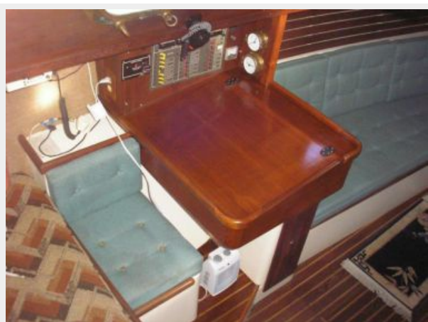
Nav Station & Quarterberth