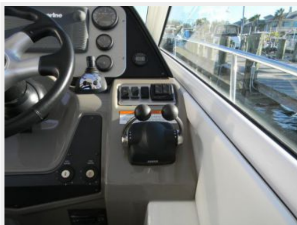
Electronic Controls & Joystick