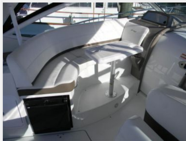
Helm Companion Seating