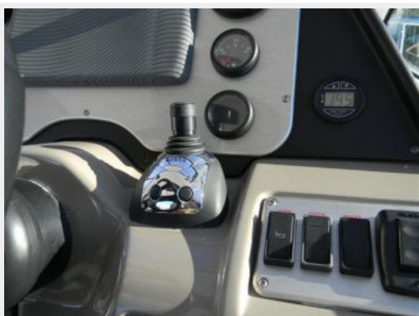
IPS Joy Control