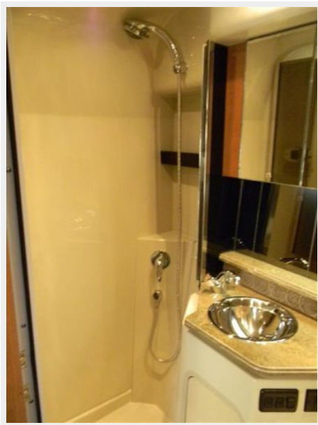
Separate Shower Stall