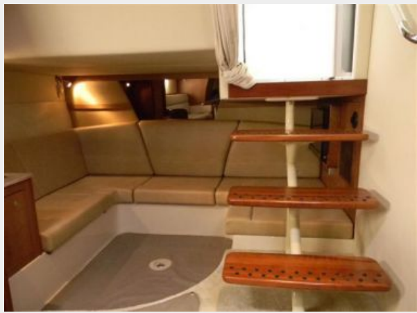
Mid- Cabin Aft Seating