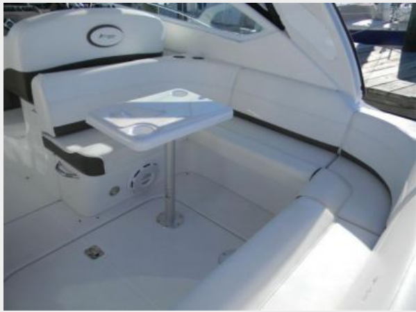
Aft Cockpit Seating