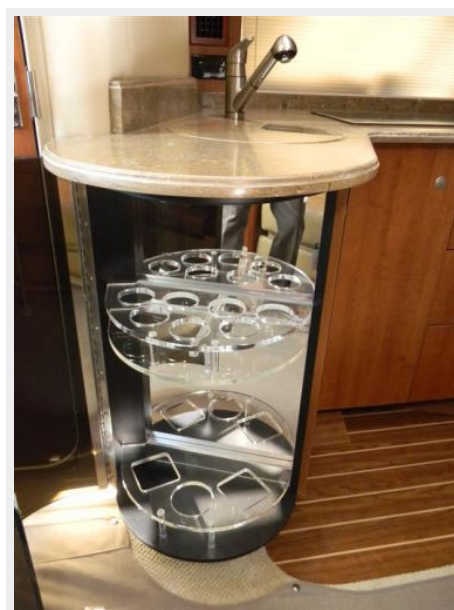
Salon Bottle Storage