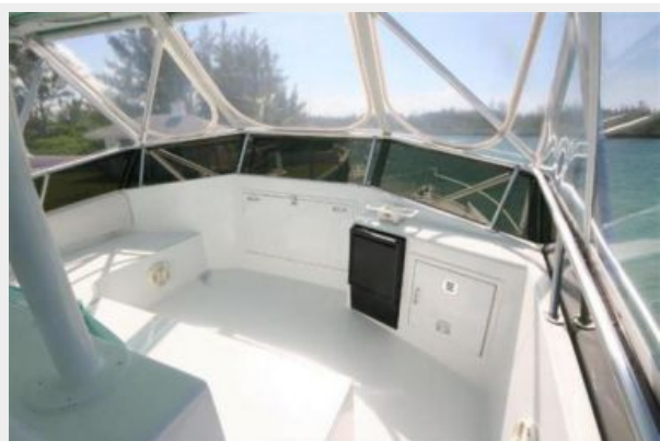
Fly Bridge Forward