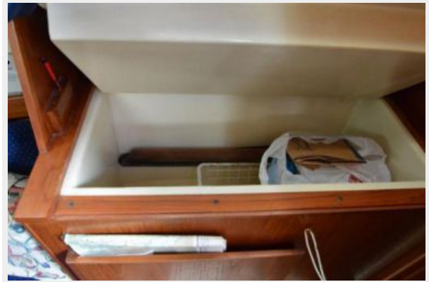
28 Pearson, Built in Cabin Ice Box