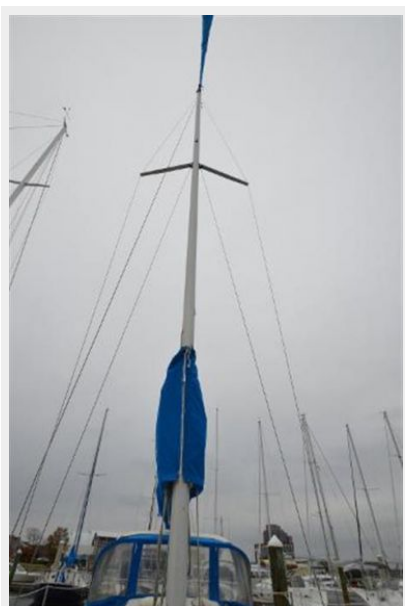
28 Pearson, Looking Up