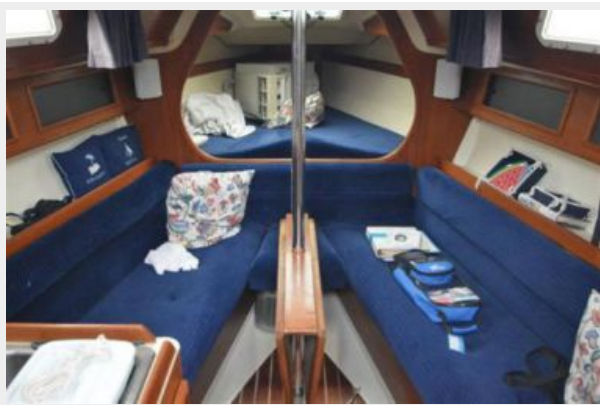
28 Pearson, Clean, Comfortable Cabin