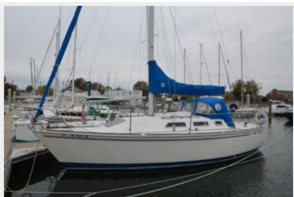
28 Pearson, Port Bow