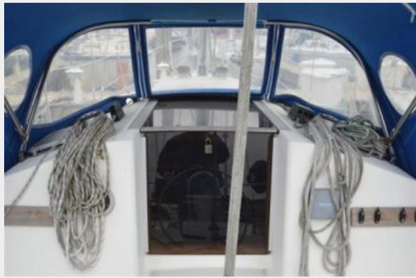
28 Pearson, Cabin Entrance