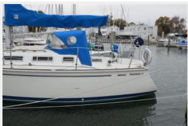
28 Pearson, Bimini Dodger