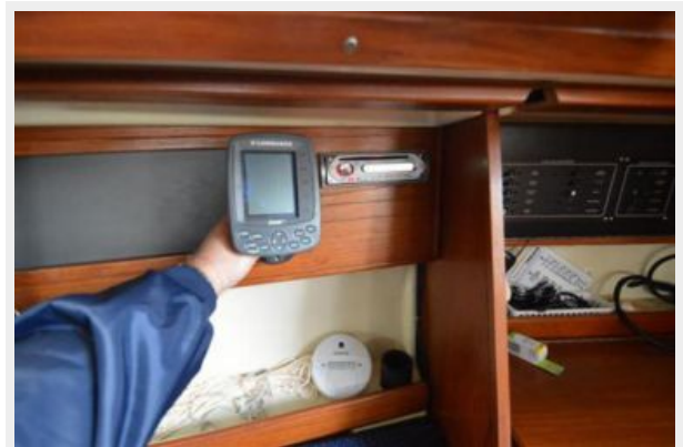
28 Pearson, New GPS and Stereo