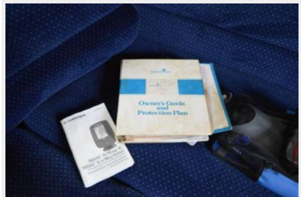
28 Pearson, Owner's Manuals