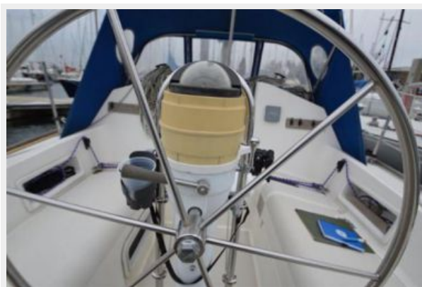
28 Pearson, Engine Controls