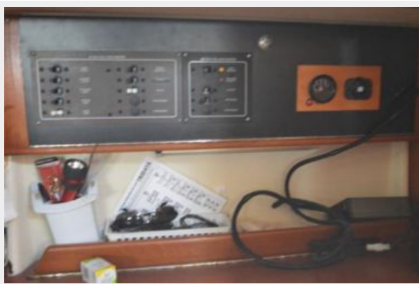
28 Pearson, Breaker Panel, Fuel Gauge, and 12v Cabin Outlet