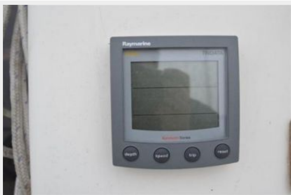
28 Pearson, Depth Finder