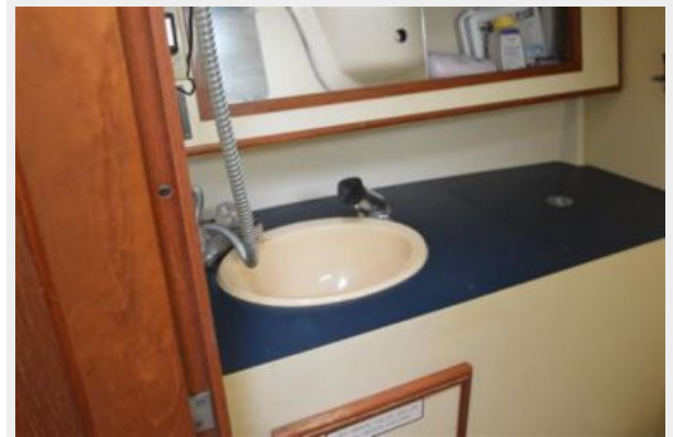
28 Pearson, Clean and Functional Galley