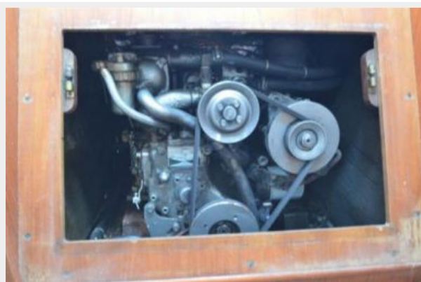
28 Pearson, 18hp Diesel Engine