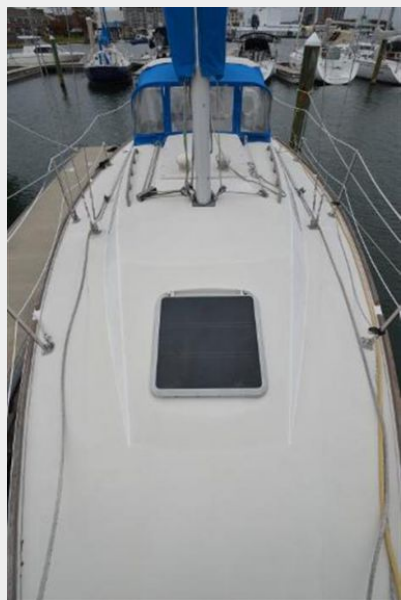
28 Pearson, Looking Aft