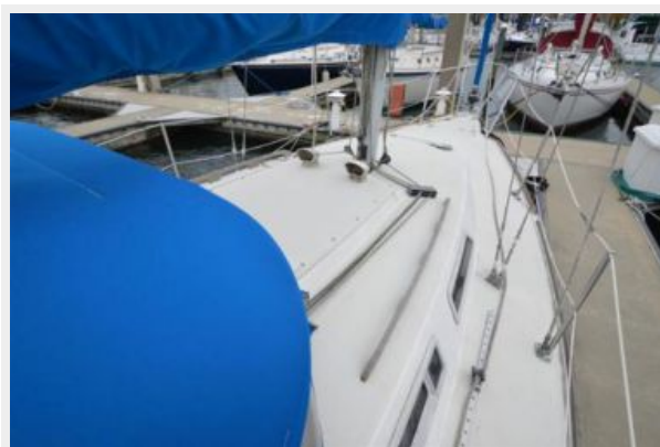
28 Pearson, Foredeck