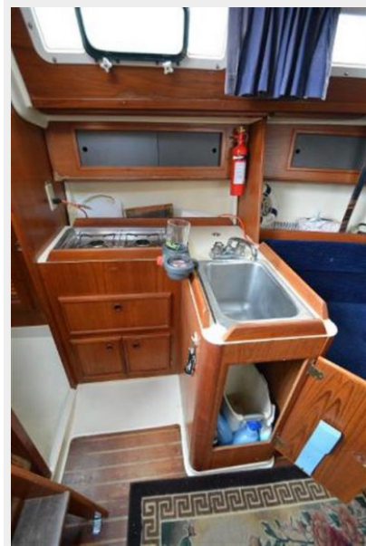
28 Pearson, Clean and Functional Galley