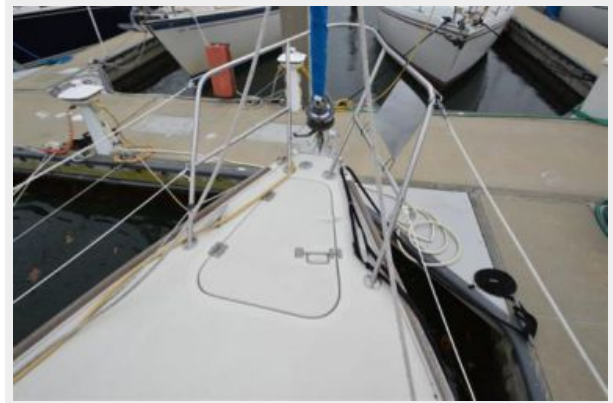
28 Pearson, Anchor Locker