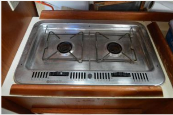
28 Pearson, 2 Burner Alcohol Stove