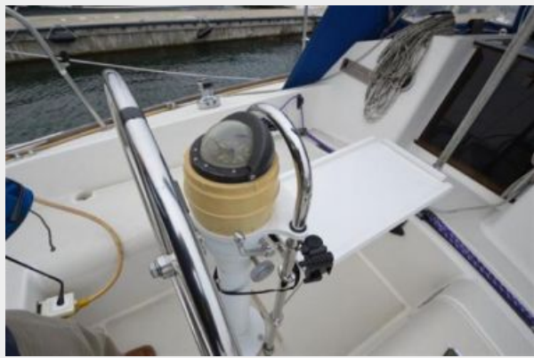
28 Pearson, Folding Cockpit Table