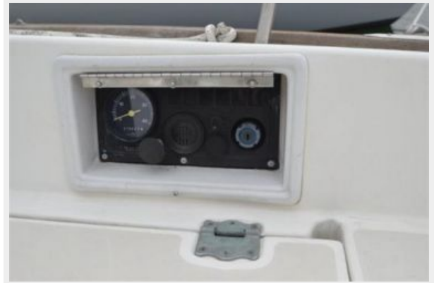
28 Pearson, Engine Panel