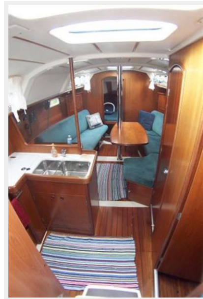
View forward from Companionway