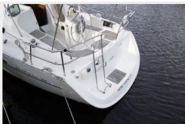
Stern view / Swim Ladder