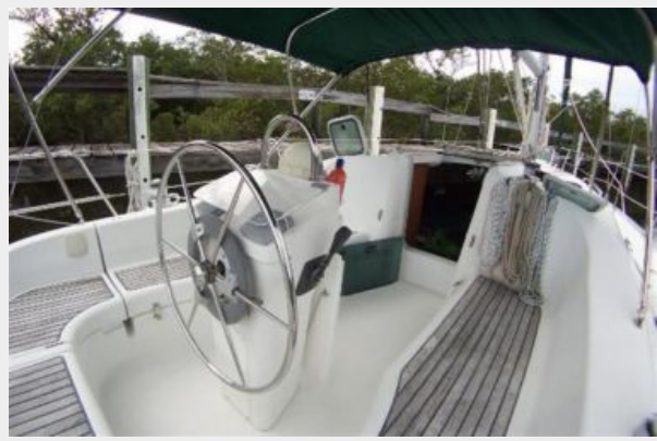
Helm / Cockpit forward