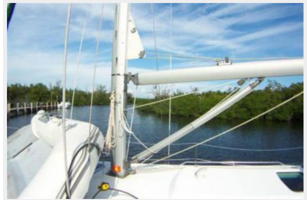
Rigid Boom Vang