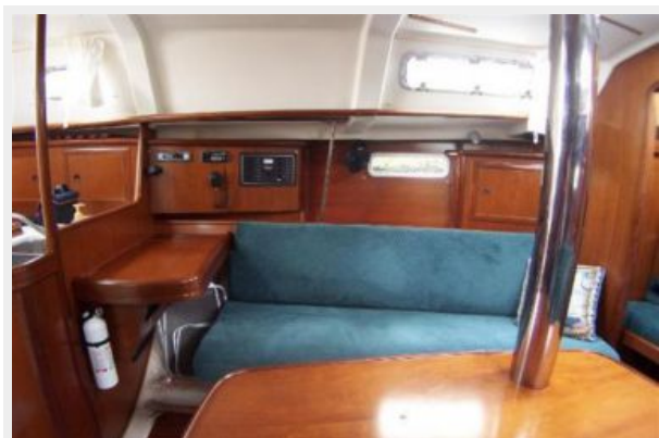
Settee to port