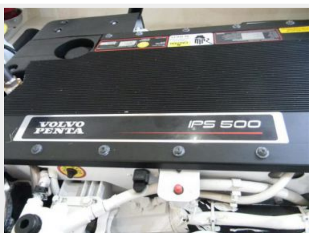
Volvo IPS 500