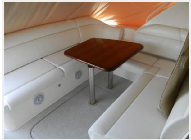
Cockpit Seating and Table