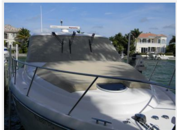
Foredeck Sunpad and Windshield Cover