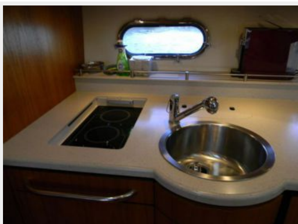
Galley Sink and Stove