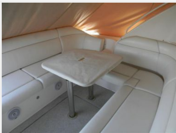
Cockpit Table with Cover