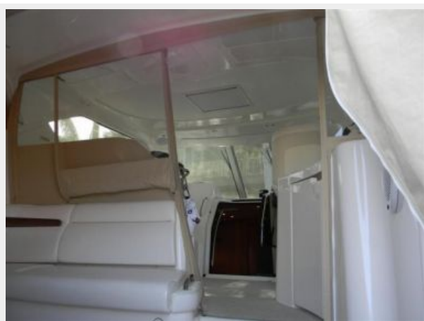
Custom Drop Curtain