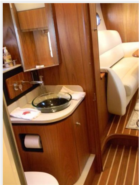
Head and Vanity