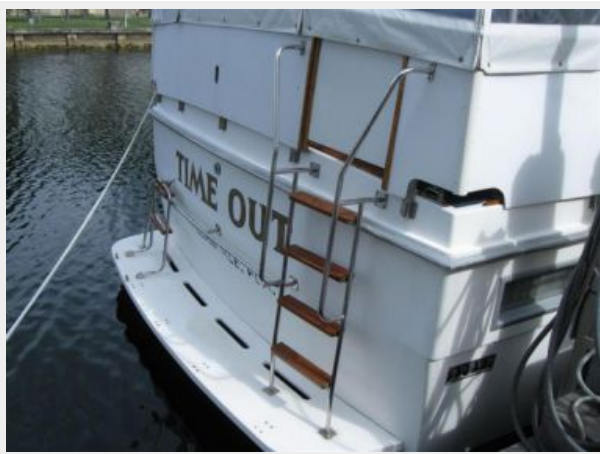
Transom and Platform