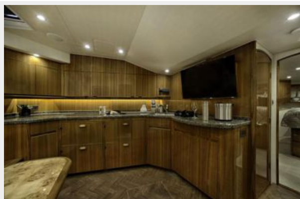
Sistership - Galley