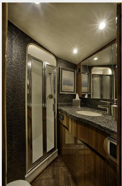
Sistership - Master Head