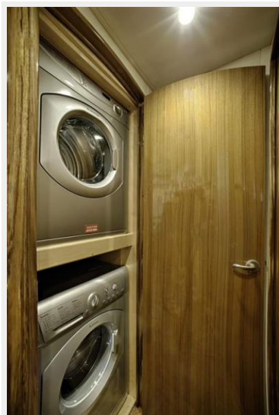
Sistership - Washer/Dryer