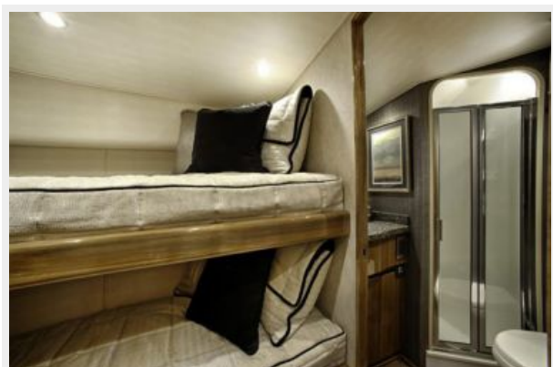
Sistership - Stateroom/Head