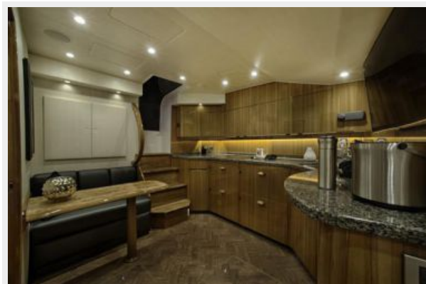
Sistership - Dinette/Galley