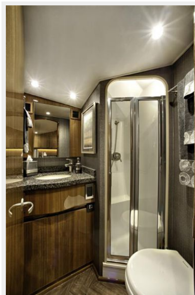
Sistership - Head