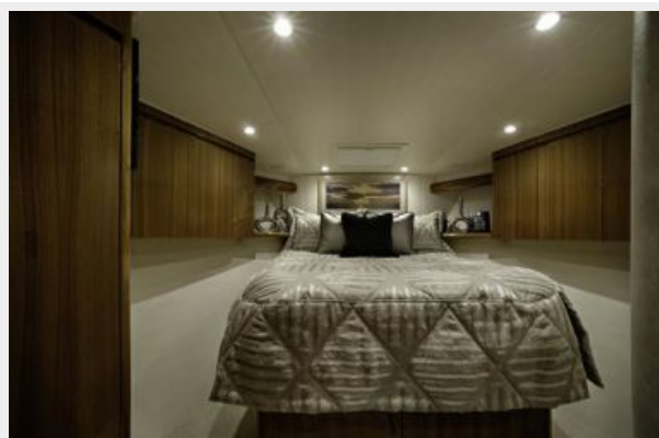
Sistership - Master Stateroom