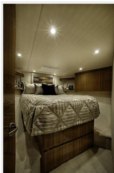
Sistership - Master Stateroom