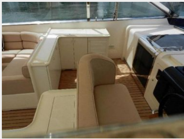
Main Deck Seating