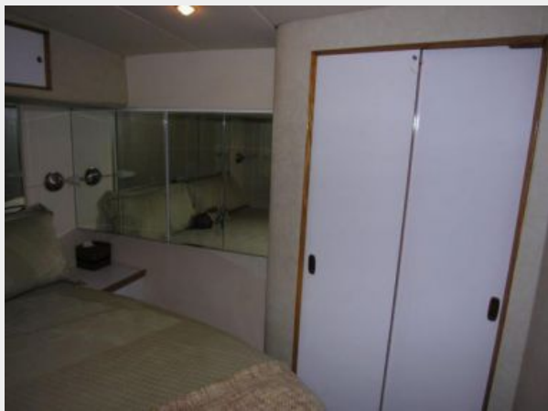
Master Stateroom Hanging Locker