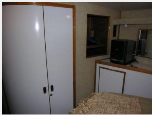
VIP Stateroom Hanging Locker