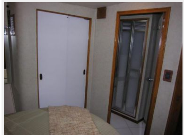
VIP Stateroom Additional Hanging Locker & Head Access