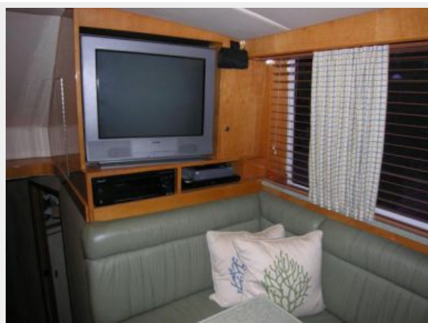
Starboard Salon Forward