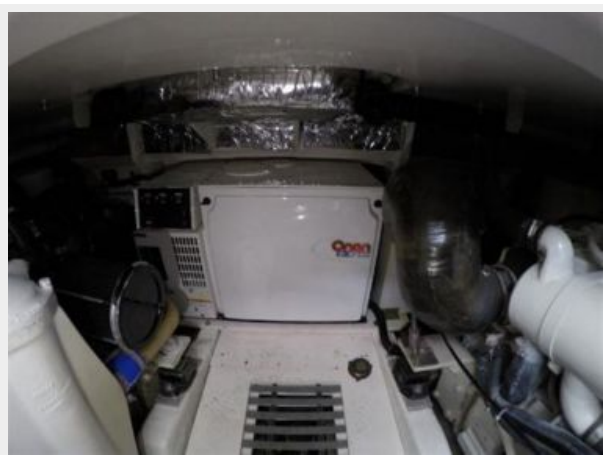
Onan Generator - Aft