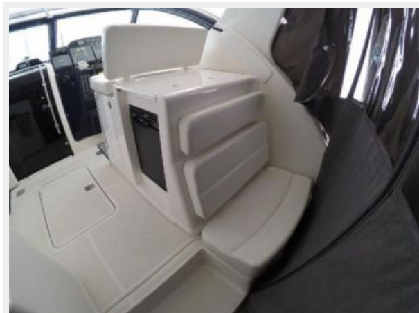
Starboard Rear Facing Seats