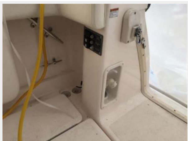
Starboard Transom Door / Fresh Water Shower