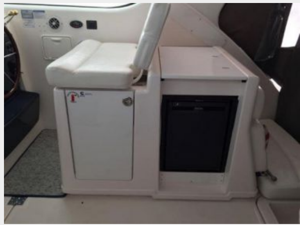
Starboard Wet Bar