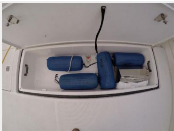
Cockpit Fish Box