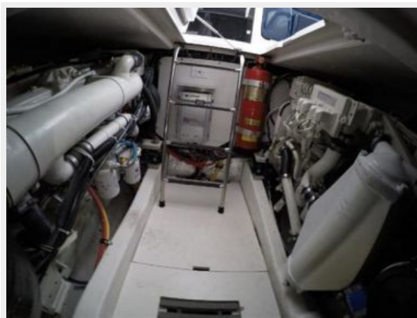
Engine Room - Facing Forward