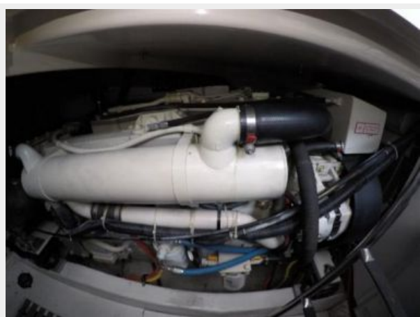
Port Main Engine