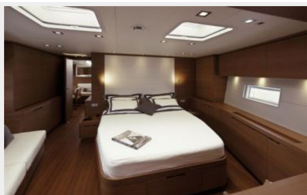
SW100 RS Cape Arrow | Owner Cabin