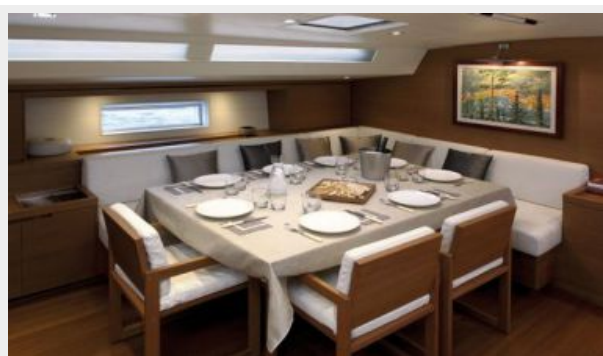
SW100 RS Cape Arrow | Saloon