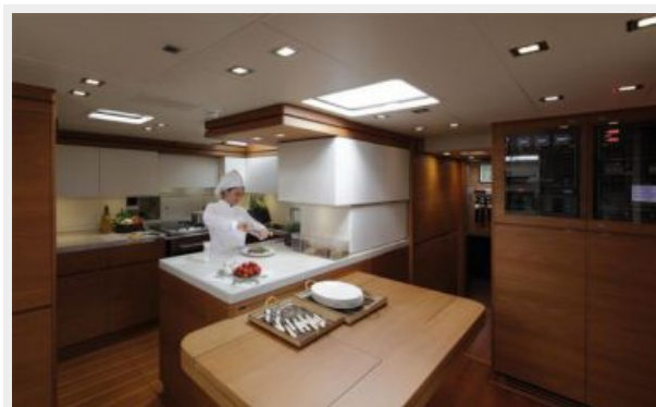
SW100 RS Cape Arrow | Galley