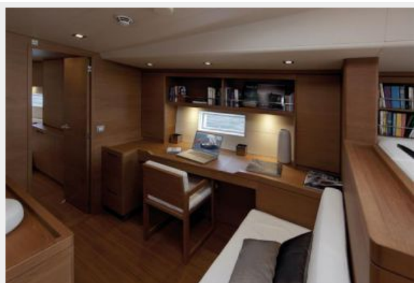
SW100 RS Cape Arrow | Studio