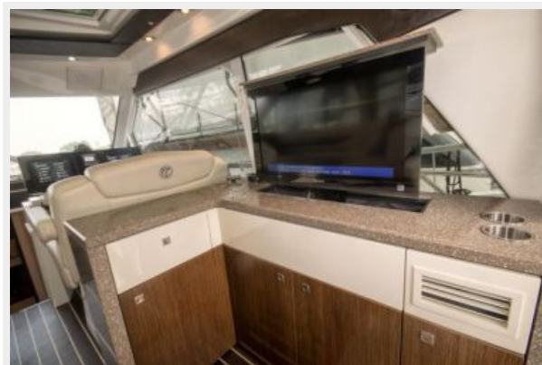
Upper Salon- Pop-up TV