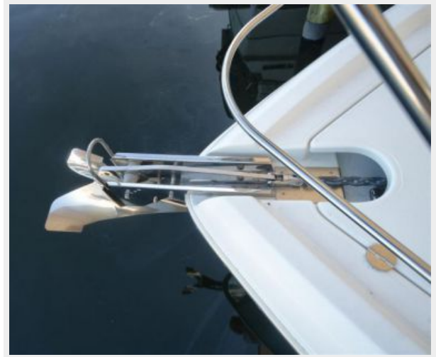
Bow Stainless Steel Anchor