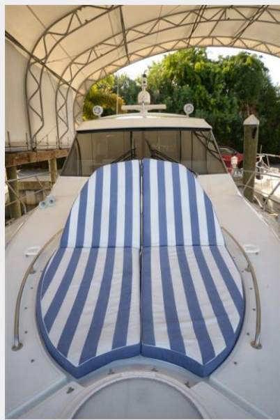
Bow Sun Pad