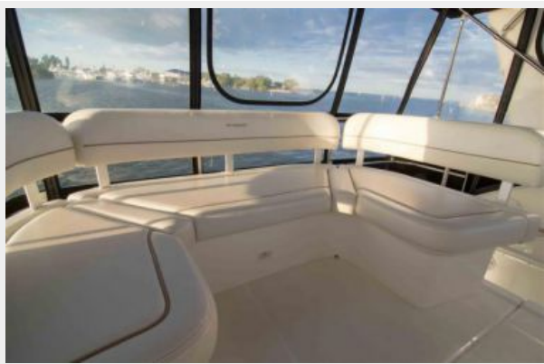
Large Bench Bridge Seating