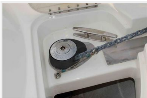
Windlass with Cover