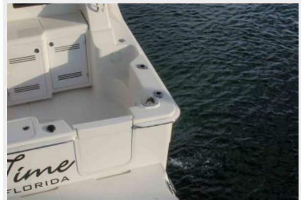
Livewell (Transom), Tuna Door, Rod Holders, Tackle Station