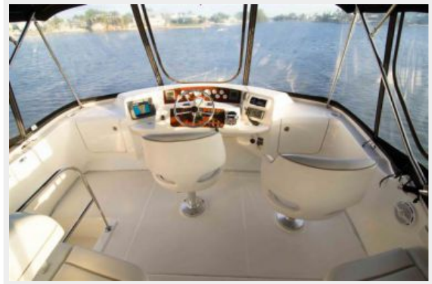
Helm Seating Captains Chairs