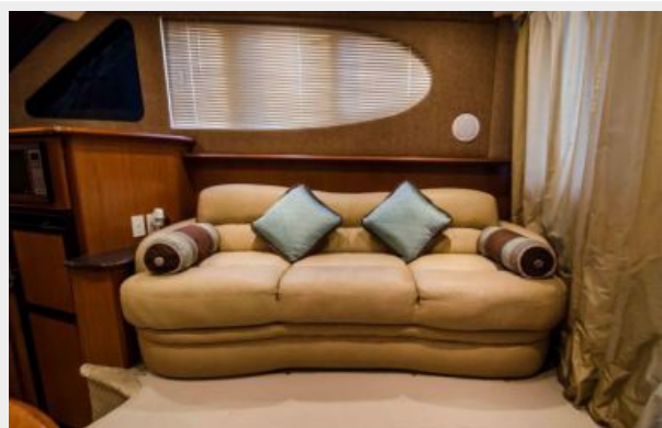
Salon - Twin Pullout w/ Extra Storage Underneath