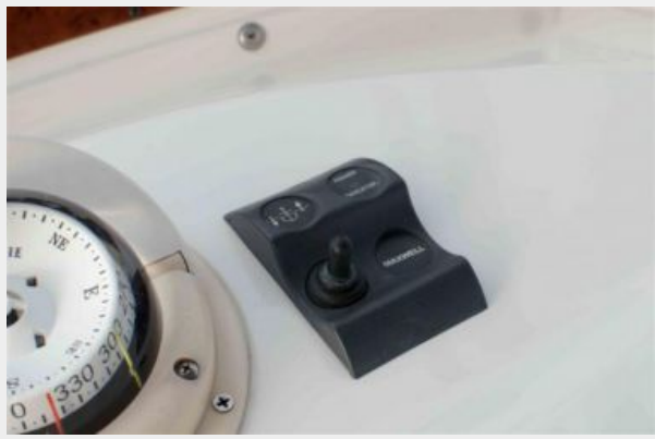
Remote Helm Windlass Control