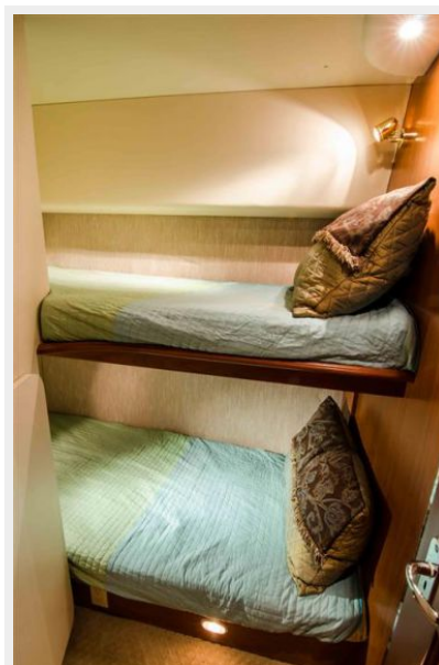
Guest Stateroom Bunks