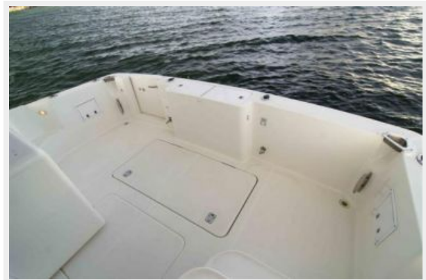
Cockpit/Huge Fishbox Lazzarette