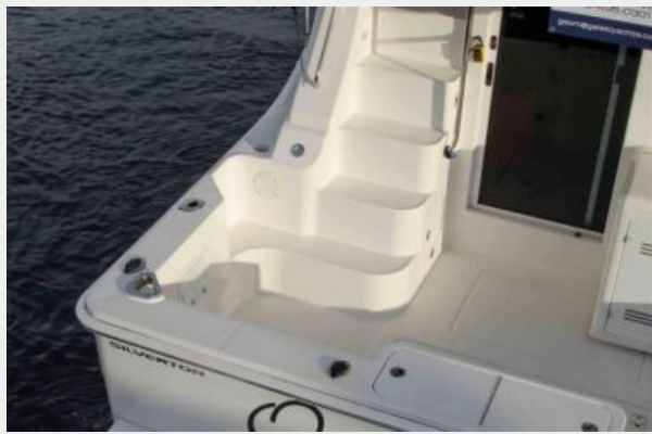
Cockpit Built In Stairs to Bridge