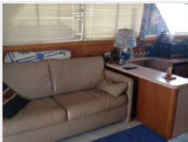
37' Silverton salon port