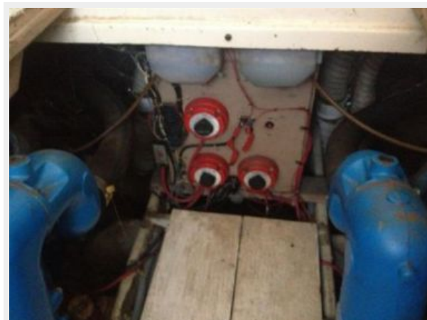
37' Silverton engine room