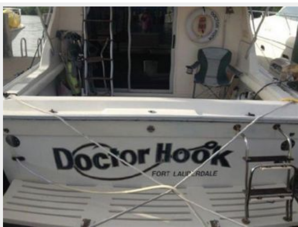
37' Silverton cockpit