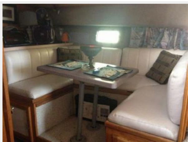
37' Silverton dinette