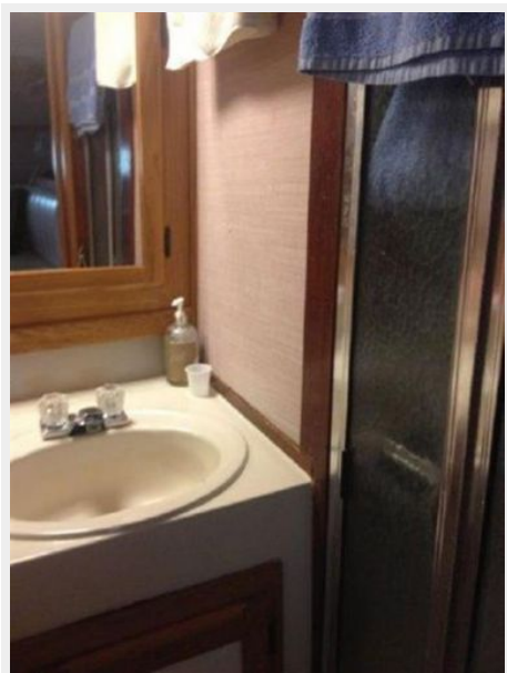
37' Silverton head photo2