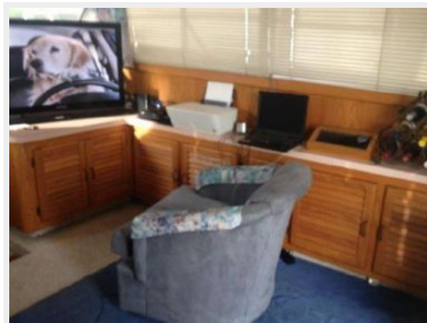
37' Silverton salon starboard