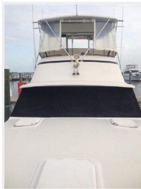
37' Silverton foredeck aft