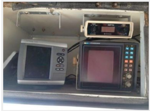
37' Silverton flybridge helm electronics photo2