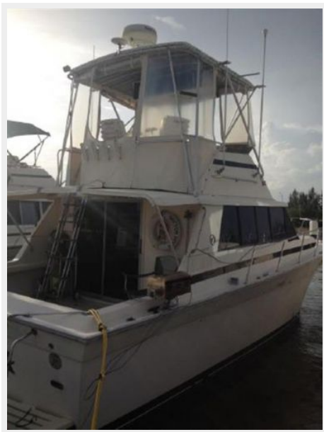
37' silverton starboard aft profile