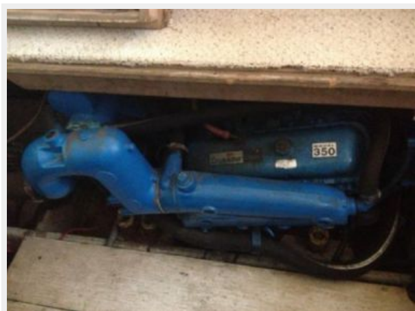
37' Silverton port main engine