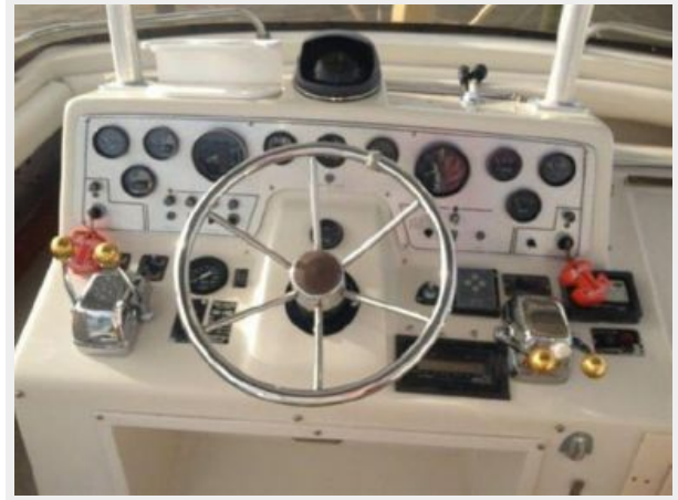
37' Silverton flybridge helm