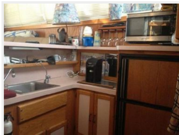
37' Silverton galley