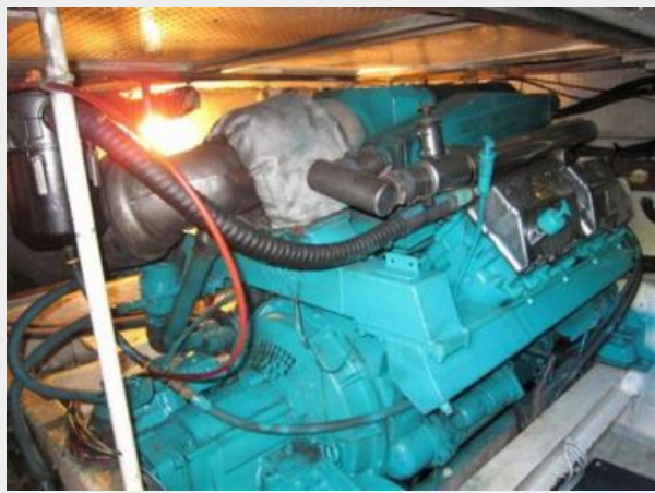
Mack Diesel Port