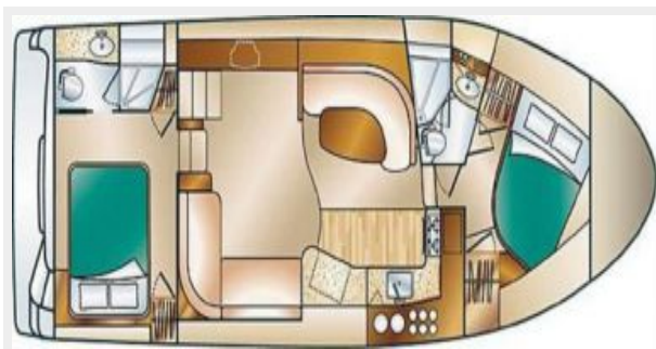
Silverton 392 Layout