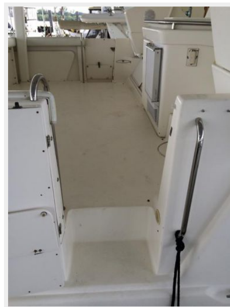
Aft Deck Entry