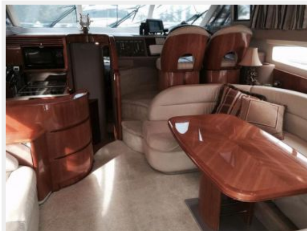
Salon looking forward