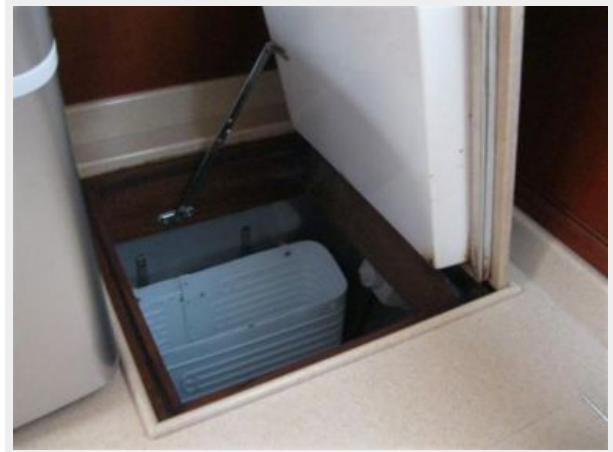
Adler Barber chest refrigerator.