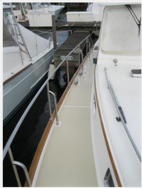
Starboard side deck