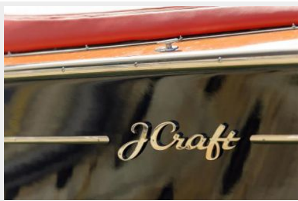
Chrome builders logo