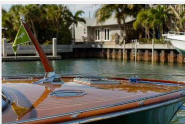
Mahogany bow deck