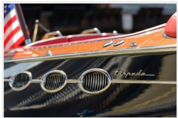
Chrome air intakes