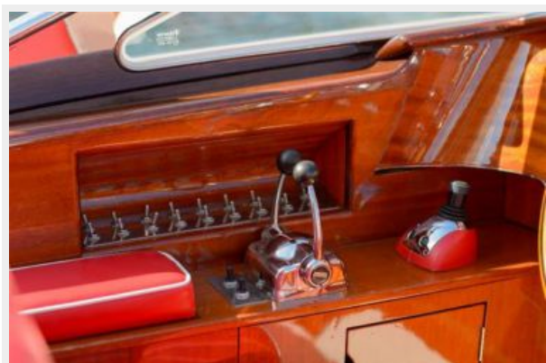
Controls featuring Volvo Joystick