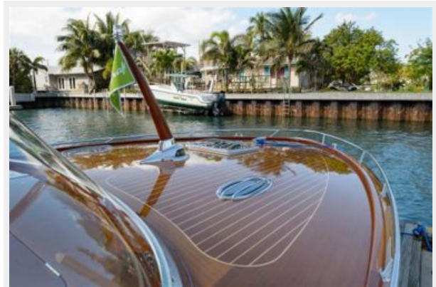
Custom chrome running light with mahogany burgee staff