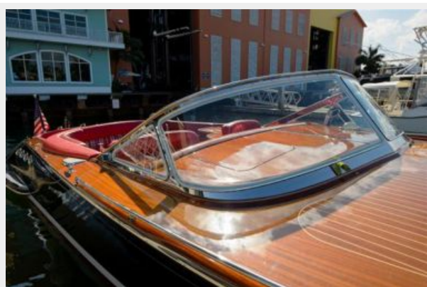
Chrome and glass windshield