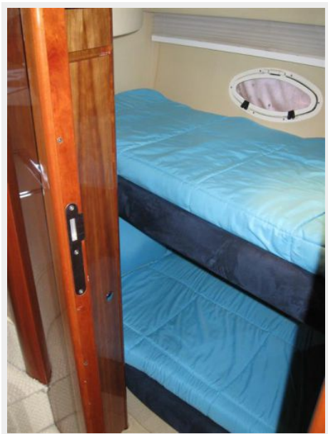
2nd Guest SR