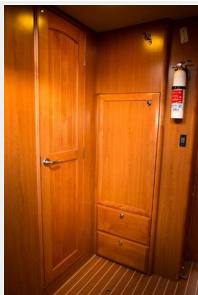
Fwd Cabin (Starboard) 2