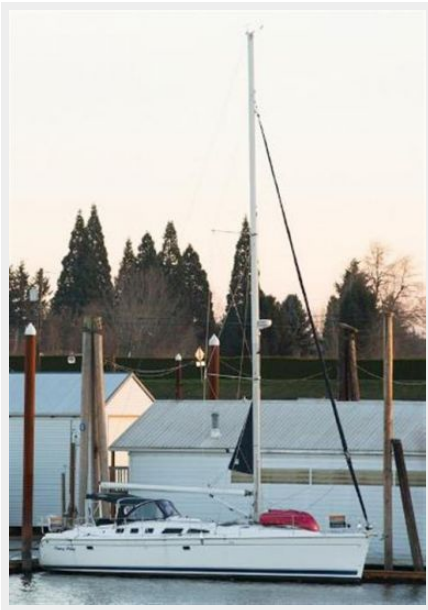
Full View (with Rig)