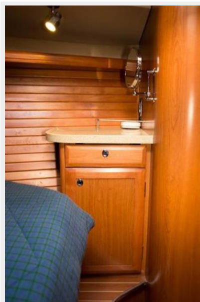
Fwd cabin (Starboard)