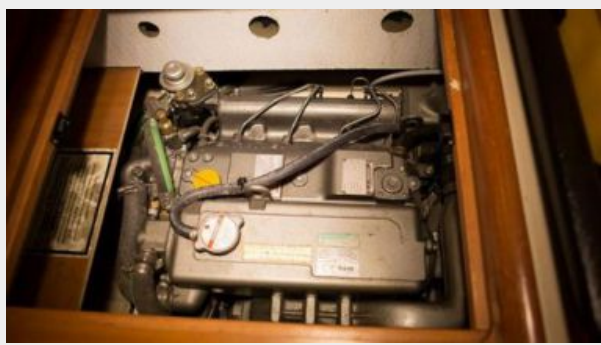
Engine - Yanmar 110HP