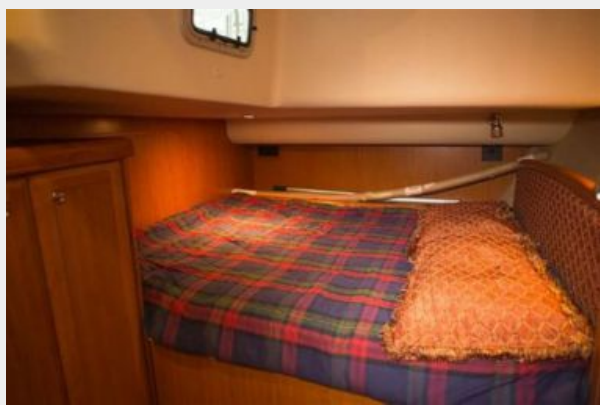
Port Aft Cabin 2