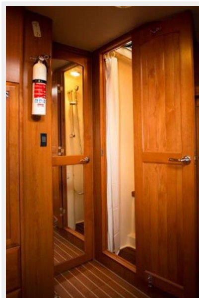
Fwd Cabin - Shower Stall