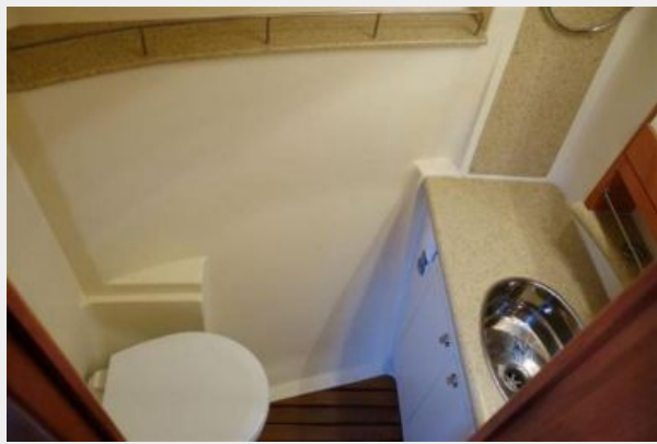
Fwd Cabin Head 2