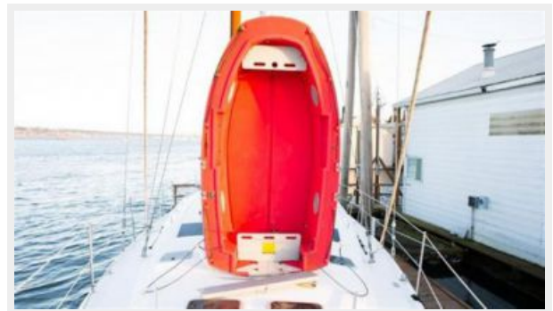
Tender - Portland Pudgy