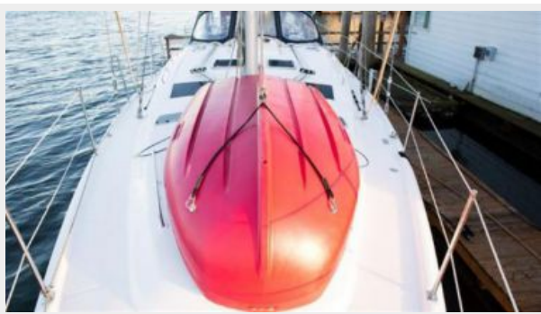
Portland Pudgy Tender