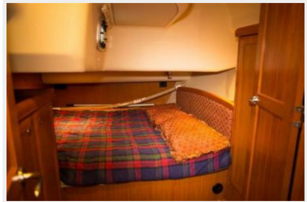
Port Aft Cabin