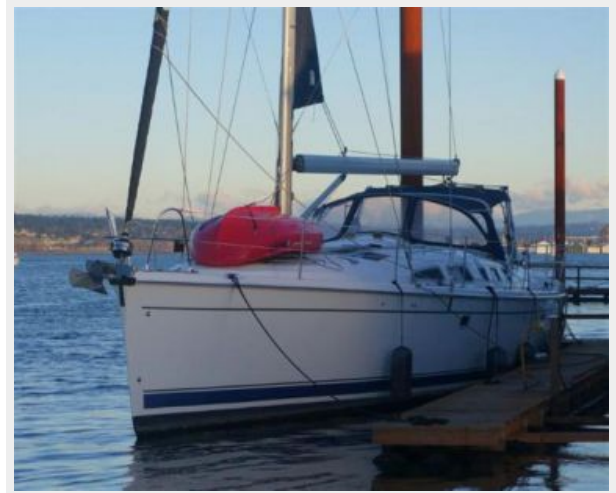
Port Side View