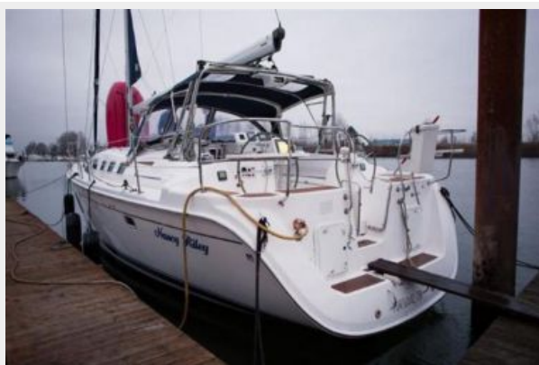
Port Aft View