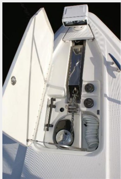
windlass and bow locker detail