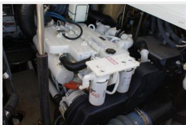
starboard Cummins QSB 5.9