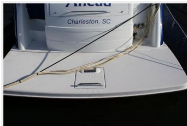
swim platform detail