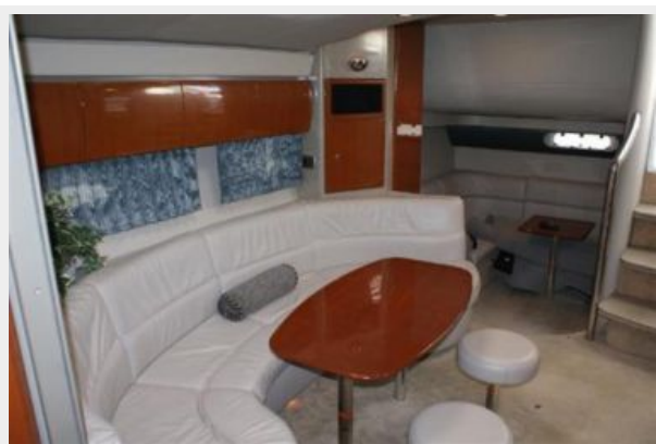
salon settee and table with removable stools