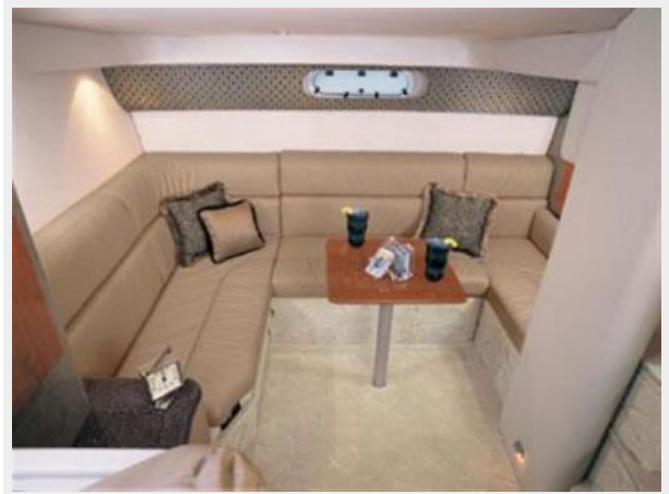
aft cabin manufacturer photo