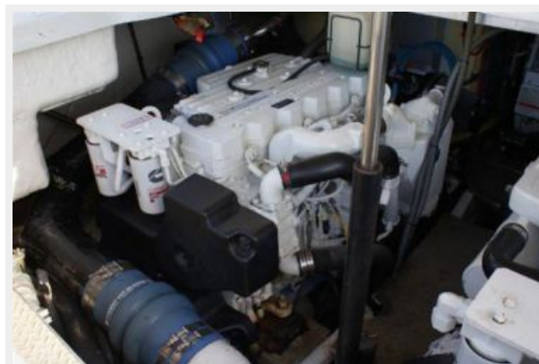
port Cummins QSB 5.9