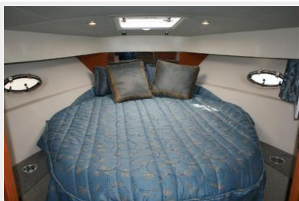
master with centerline queen