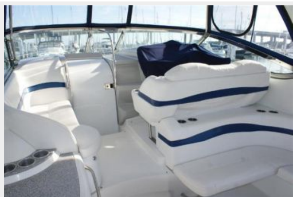
cockpit starboard forward