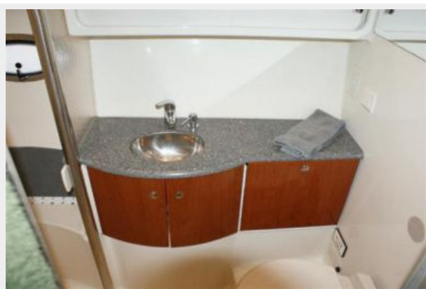
head and fully enclosed shower aft