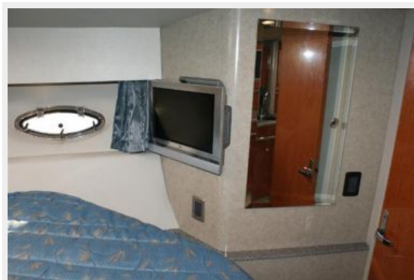
master to starboard