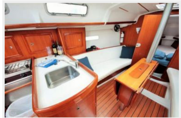
Beneteau 323 Interior portside