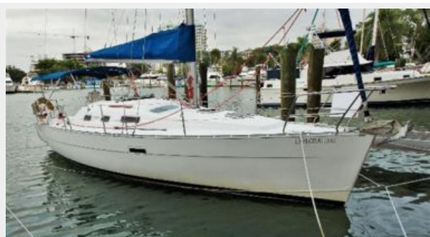
Beneteau 323 Profile