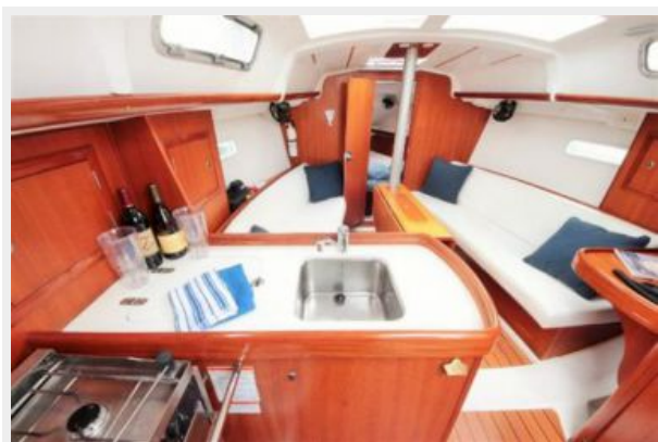
Beneteau 323 Interior