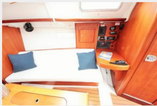
Beneteau 323 Interior Starboard