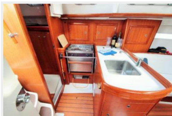
Beneteau 323 Galley