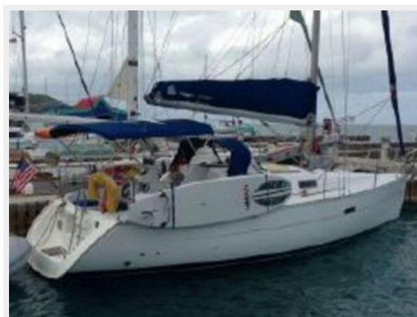
Beneteau 323 Profile