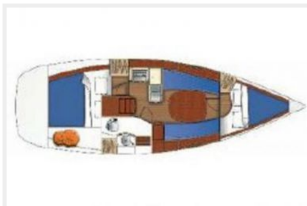
Beneteau 323 Layout