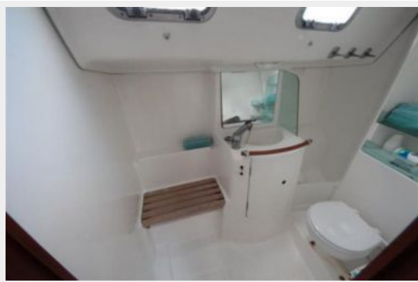
Beneteau 323 Huge Head with Shower