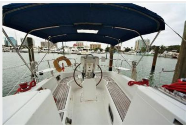
Beneteau 323 cockpit