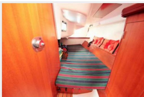
Beneteau 323 Queen berth Aft Stateroom