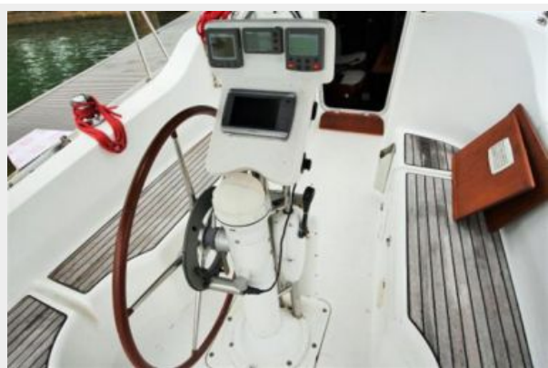
Beneteau 323 Helm with wheel moved