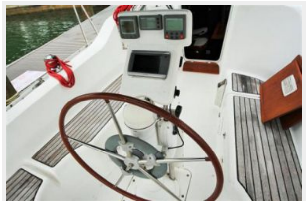
Beneteau 323 Helm