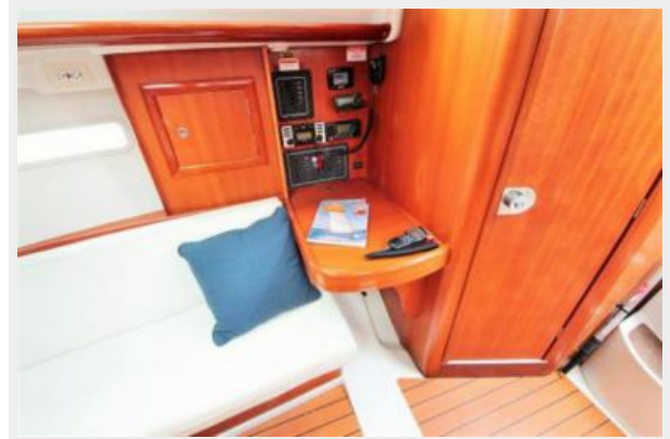
Beneteau 323 Nav Station