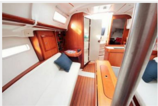
Beneteau 323 Interior Starboard