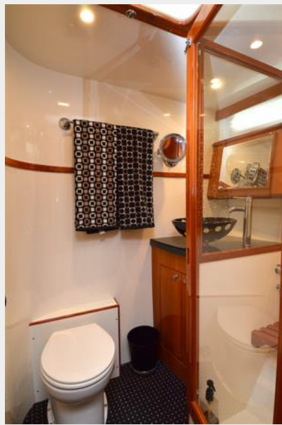
Guest Stateroom Head