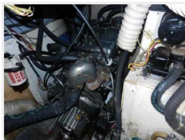
Yanmar 20 hp 1150 hours rear view