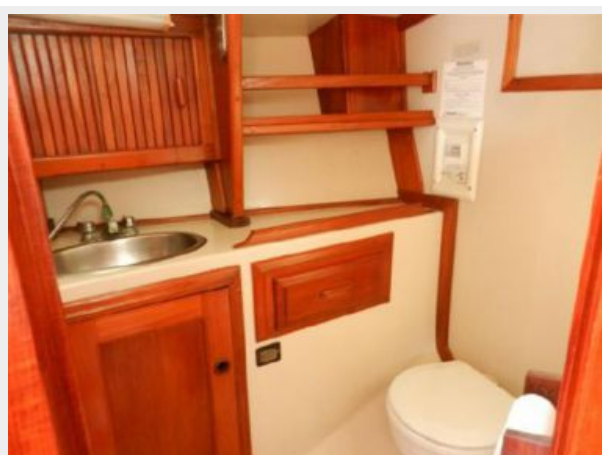
Lextrasen Head and Shower