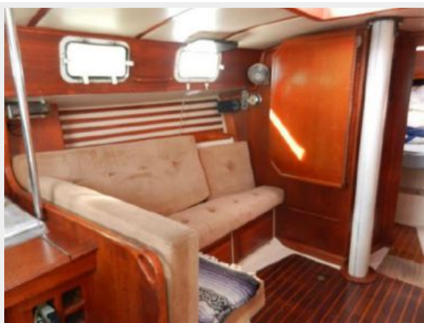
Port Salon Converts to Berth