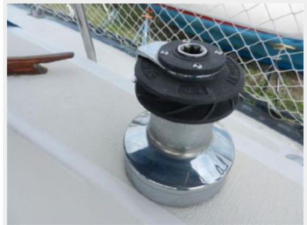
43# Primary Winches