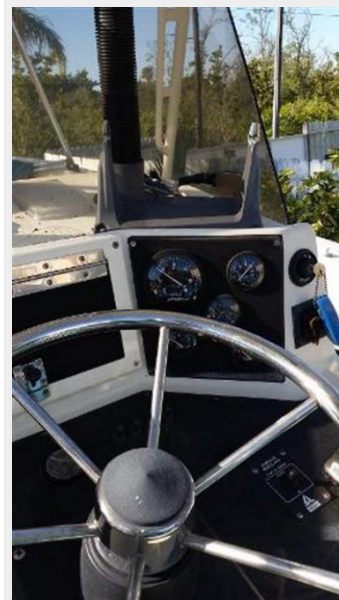
LOWER STATION CONTROLS STARBOARDSIDE