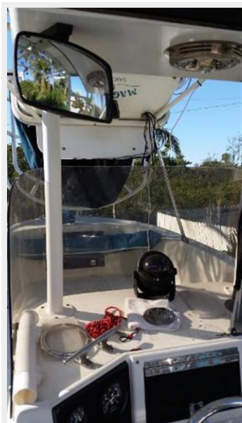
TOWER IN THE DOWN POSITION