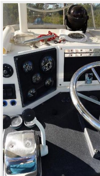
LOWER TATION CONTROLS PORTSIDE