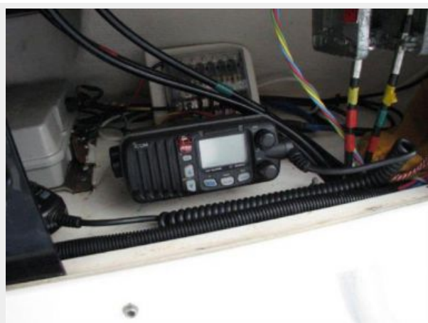
Helm / Electronics & Navigation 5 - Radio in Tower