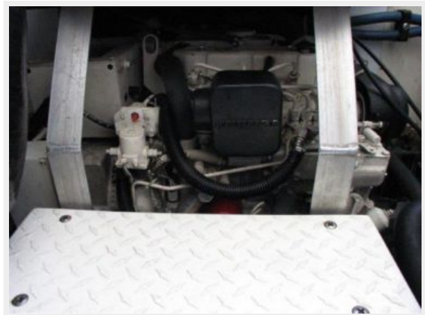
Electrical System / Equipment - Generator