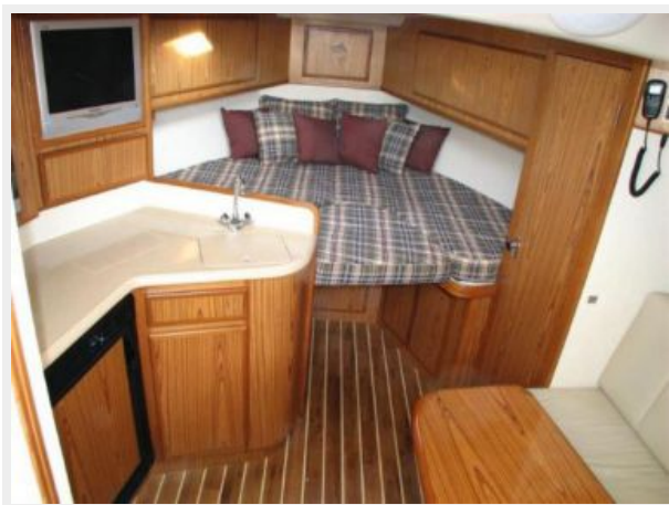
Main Cabin 1