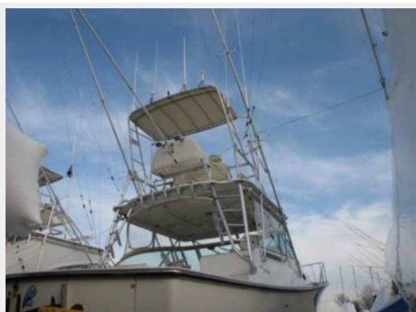
Deck 2 - Tower