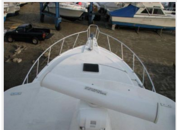
Deck 1 - Bow