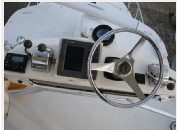
Helm / Electronics & Navigation 4 - Tower Controls