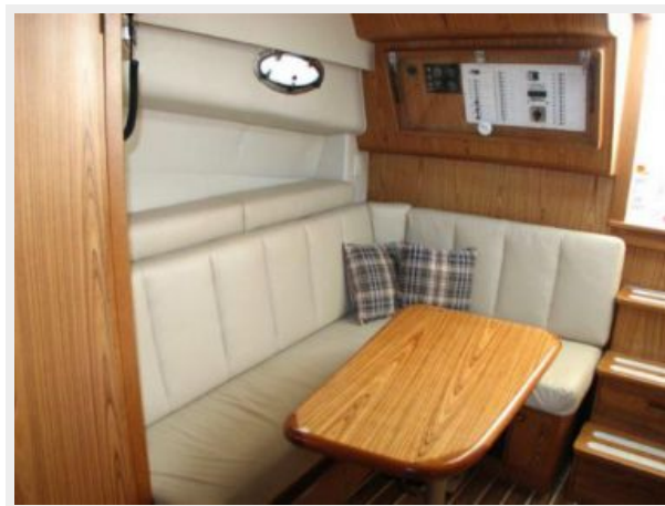
Main Cabin 2 - Dinette