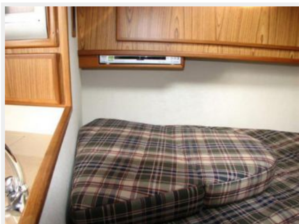
Main Cabin 3