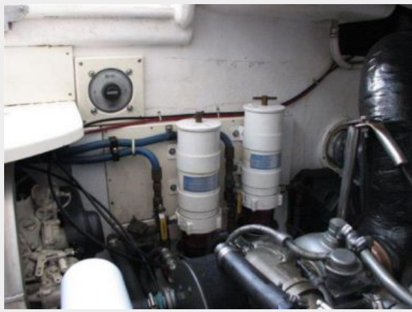
Engine & Mechanical Equipment 4