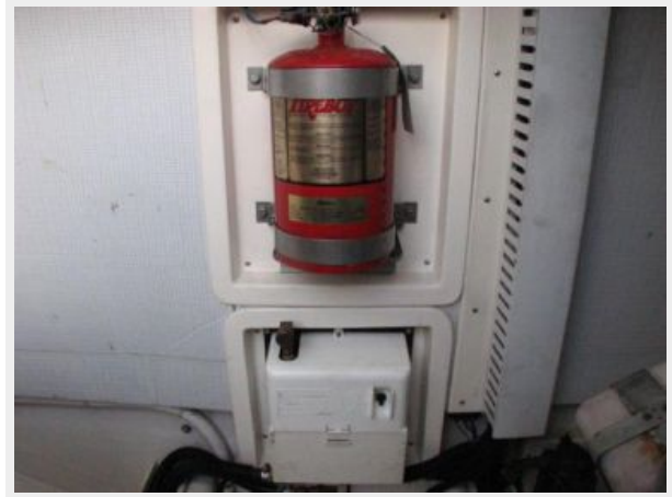
Engine & Mechanical Equipment 5