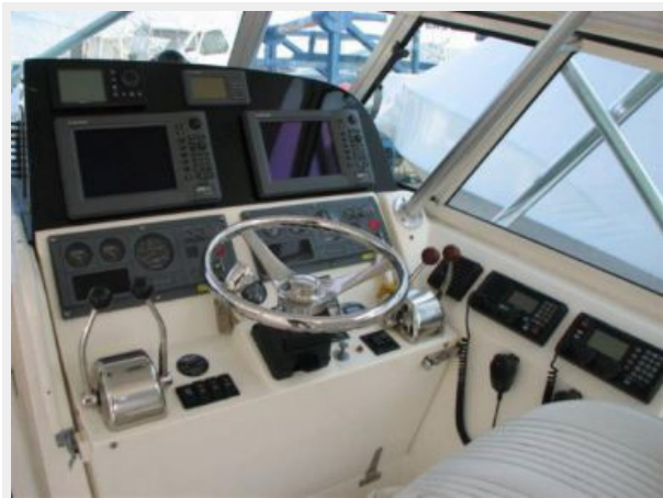
Helm / Electronics & Navigation 1