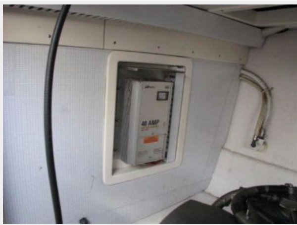
Engine & Mechanical Equipment 6