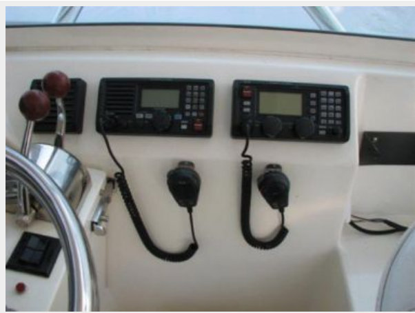
Helm / Electronics & Navigation 3