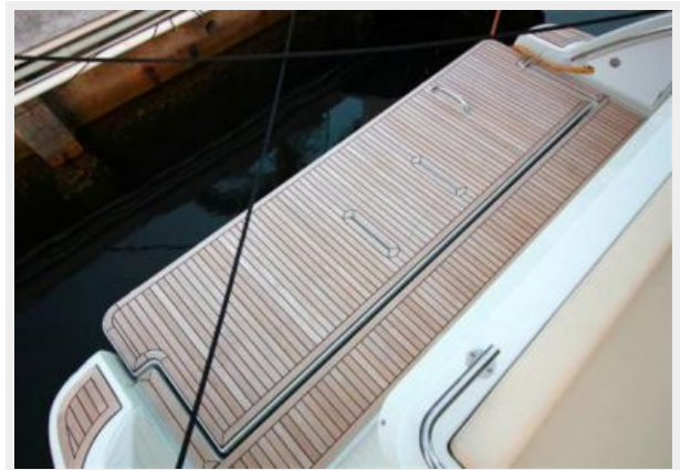
Hydraulic Swim Platform