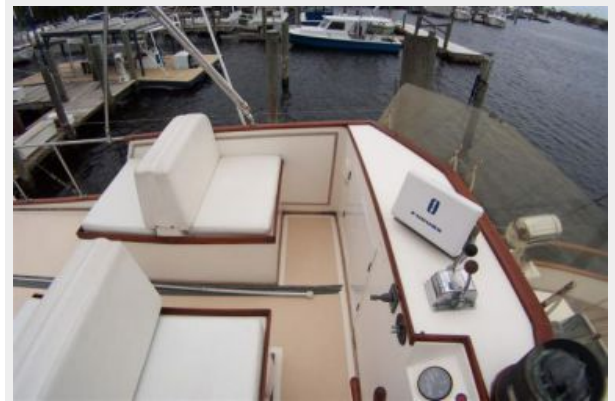
Flybridge Seating to Port