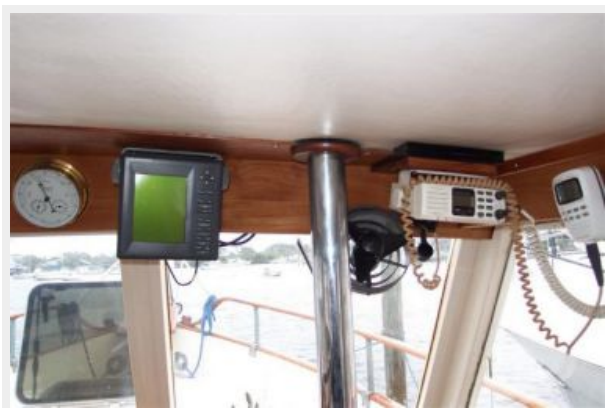
Lower Helm Electronics/VHF