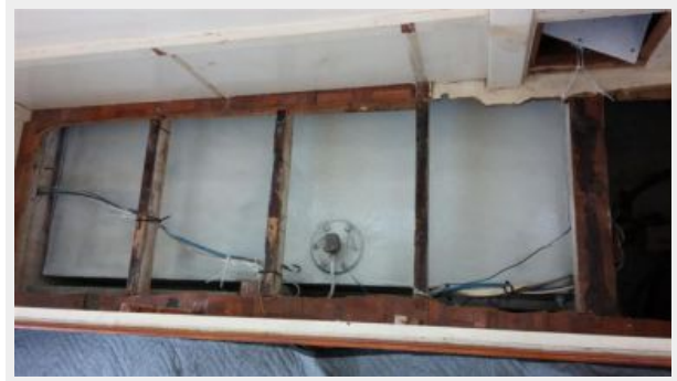
Port Fuel Tank