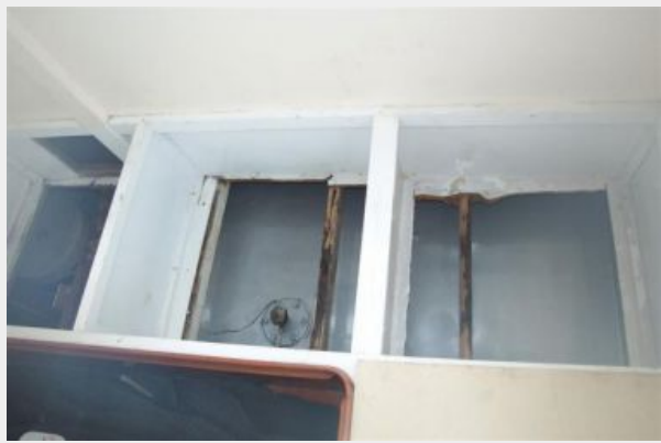
Starboard Fuel Tank