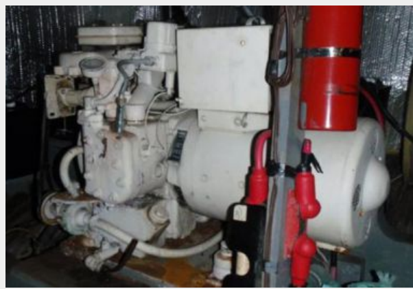
6kw Onan Generator