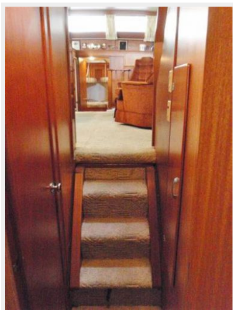
Master steps to Salon