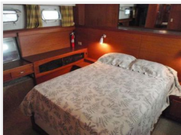
Master Berth Starboard