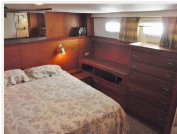
Master Berth Port