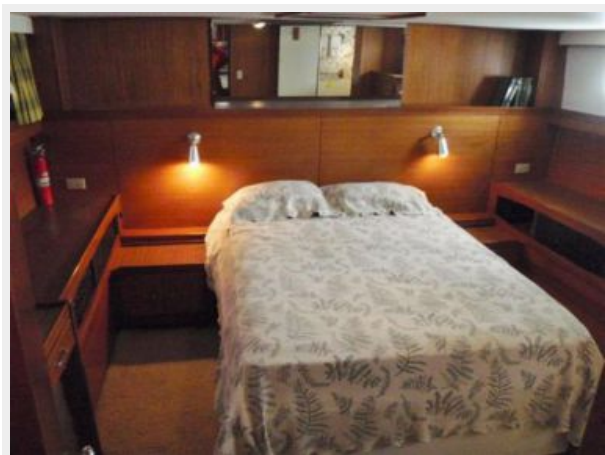
Master Stateroom Berth