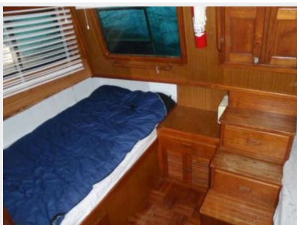
Master Berth Starboard