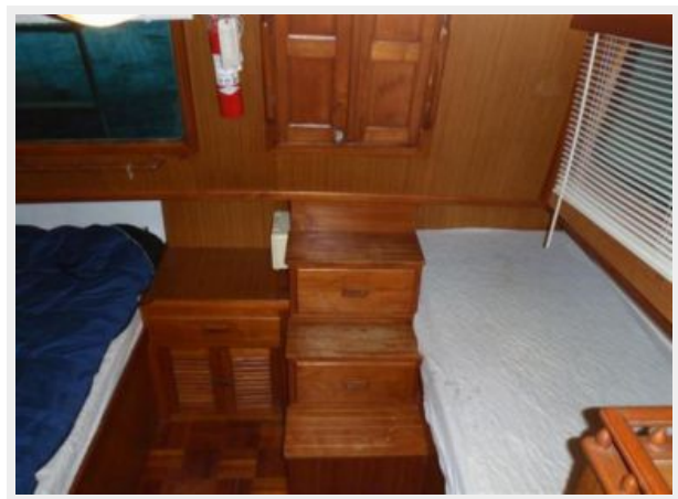
Master Aft Entrance