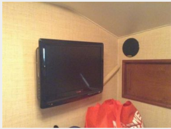
Flatscreen w/DVD in Stateroom