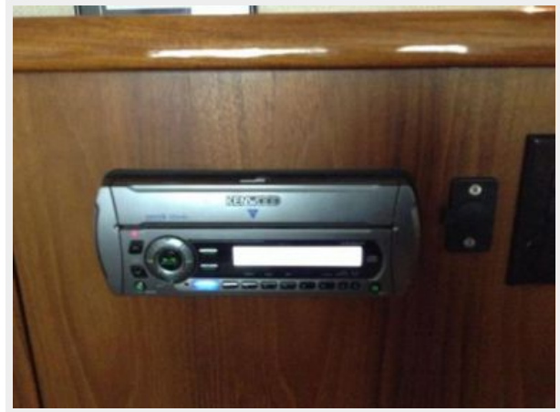
Kenwood Audio System