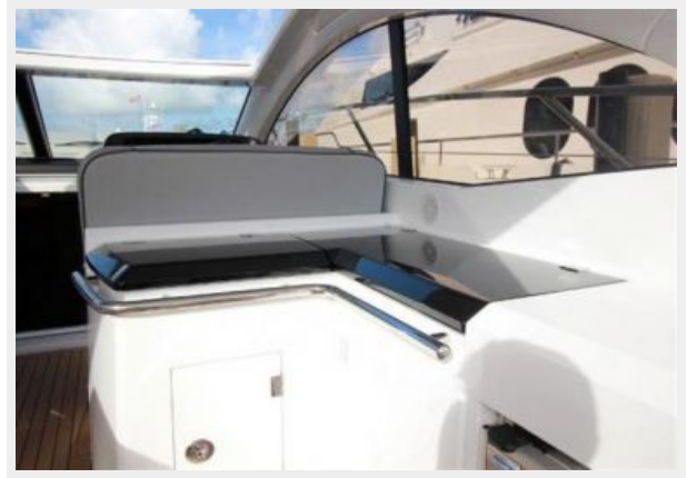
Bow Sun Deck