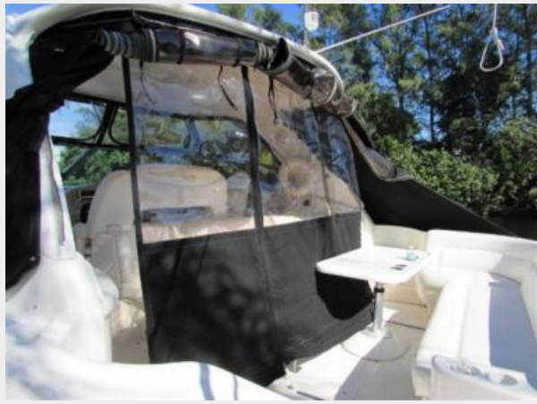
Hardly used Drop Curtain