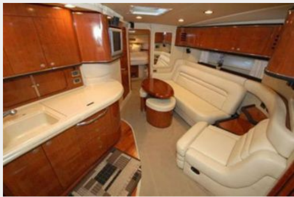
Salon seating and Galley