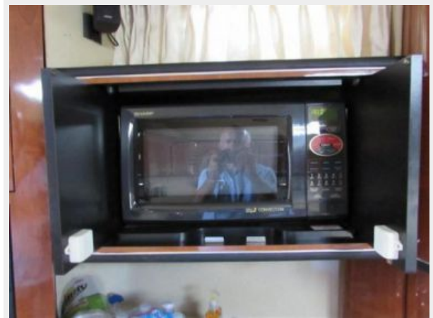
Galley Micro/Convection unit