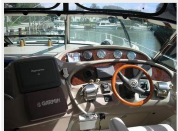
DASH FROM HELM SEAT