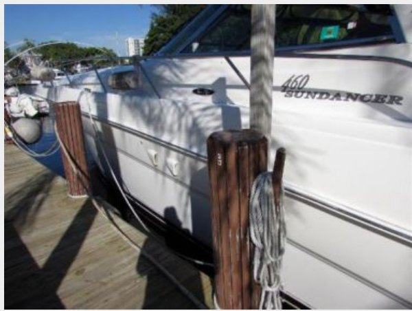
Port side hull