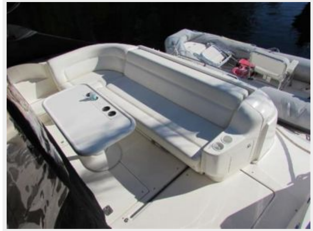
Aft cockpit and table