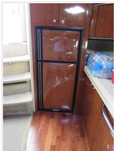
Full upright refrigerator/freezer