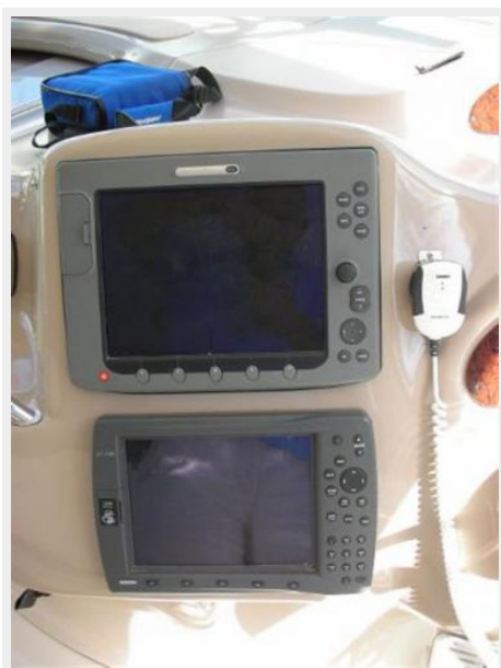
UPDATED GPS UNITS