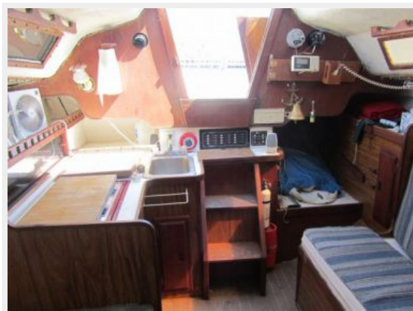
30' Seidelmann Cabin looking Aft