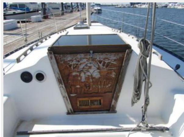
30' Seidelmann Hatch Access