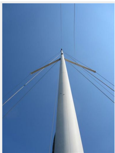
30' Seidelmann Mast and Standing Rig