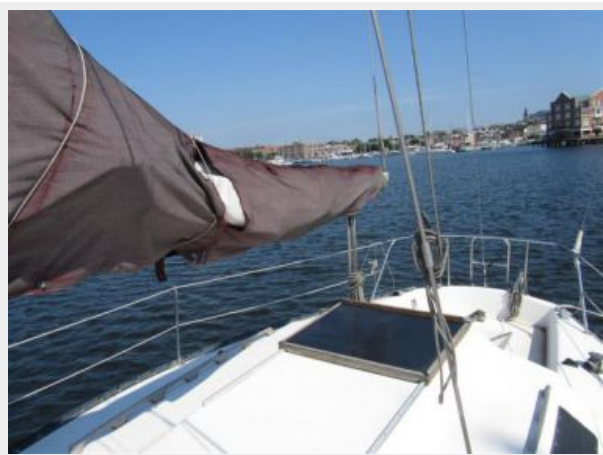
30' Seidelmann Looking Aft Port Side