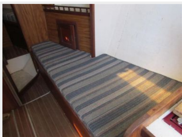
30' Seidelmann Cabin Seating