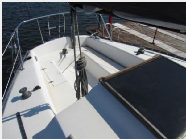
30' Seidelmann Cockpit