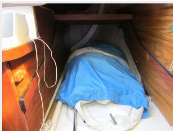
30' Seidelmann Berth or Sail Storage