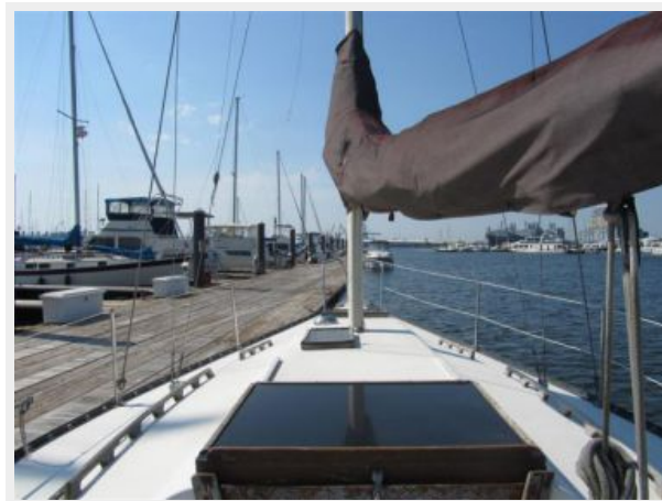
30' Seidelmann Looking Forward