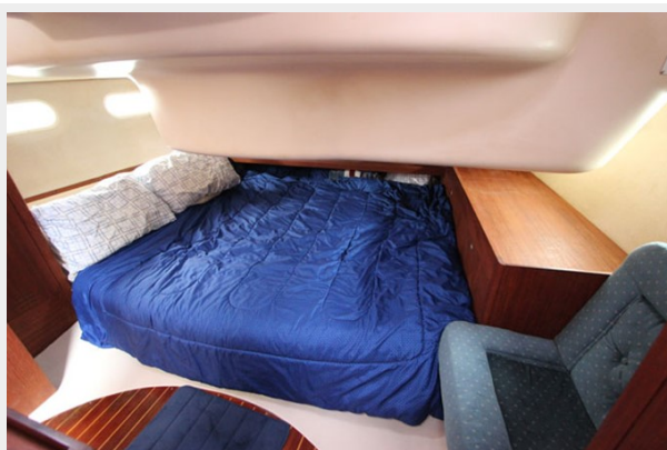
Aft Stateroom w/Large King Berth & Settee