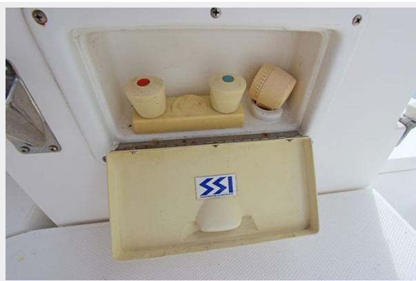
Hot & Cold Shower in Cockpit