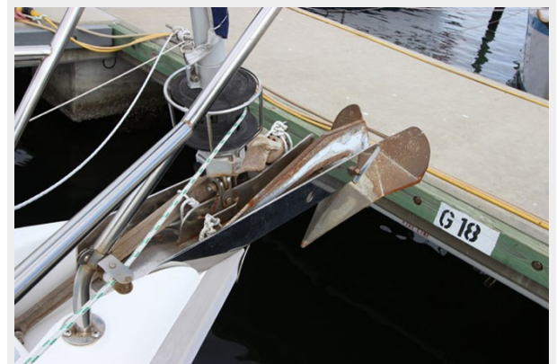
1-35lb Delta Anchor & 1-35lb CQR Plow Anchor