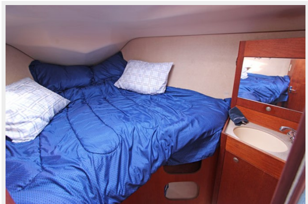
Forward Berth W/Vanity & Sink