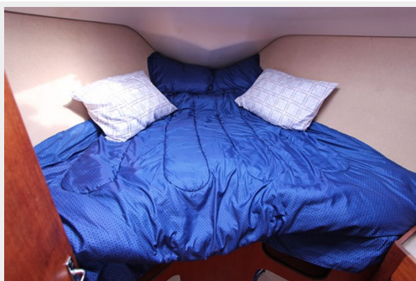
Forward Queen Berth