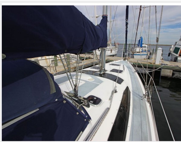
Deck Starbord Side