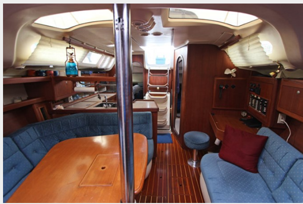
Salon Looking Aft