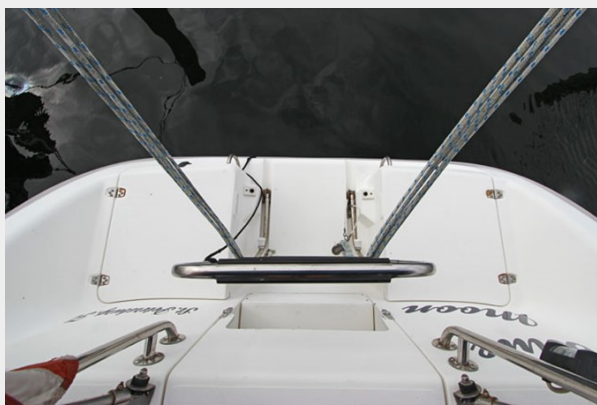
Transom Swim Platform w/Fold-down Stainless Anchor