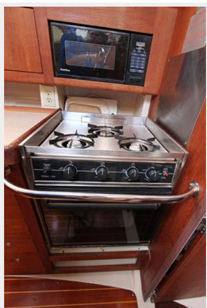
Goldstar Microwave & Princess Oven W/Propane 3-Burner Stove