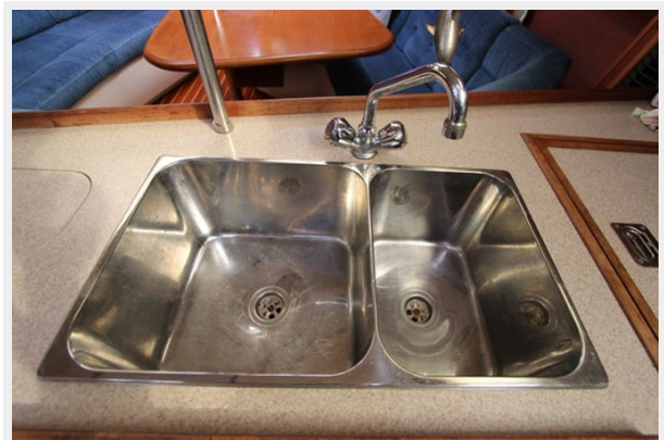
Stainless 70/30 Sink