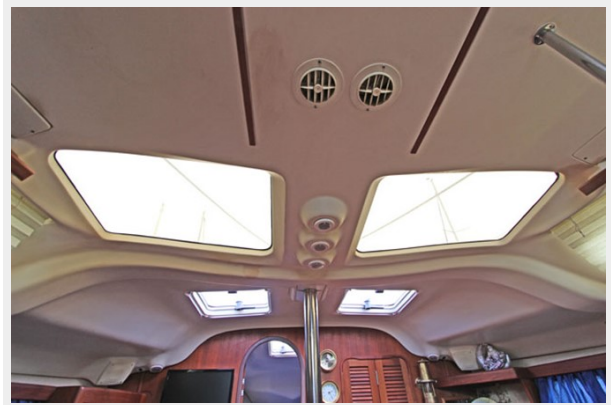
Salon Skylights To Provide Plenty Of Natural Lighting