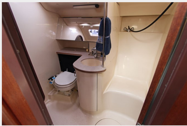
Head View from Salon Entry