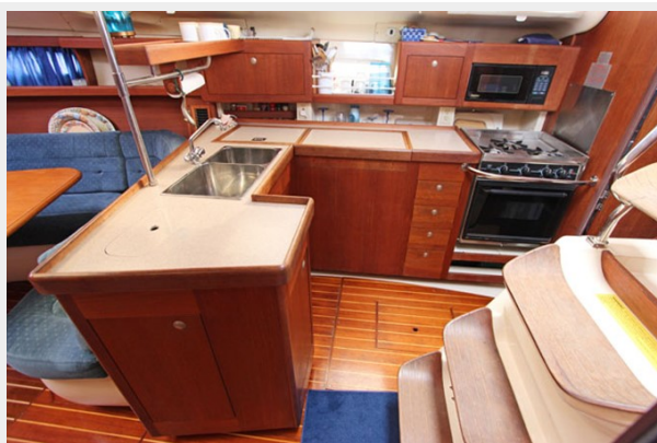
Full Galley W/Sink, Fridge, Freezer, Microwave, & Oven/Stove