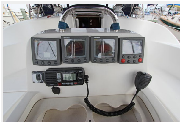
Cockpit Navigation Panel W/West Marine 580 VHF Radio, Raymarine ST60 Wind/Speed/Depth, & Raymarine ST 5000+ Autopilot