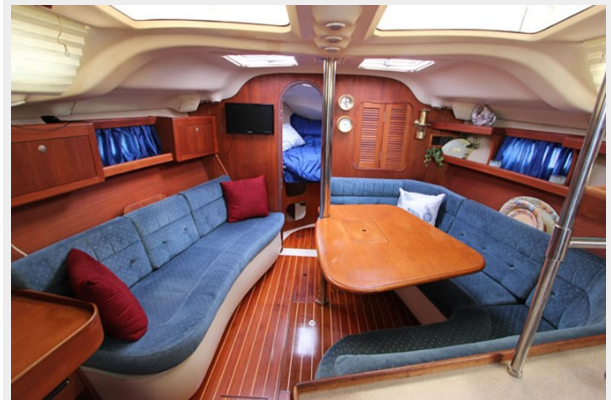
Salon Seating & Dining Area w/Teak Table, Starboard Dining Area Converts to Queen Berth