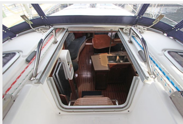
Companionway to Salon