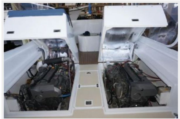
EASY ACCESS TO ENGINES