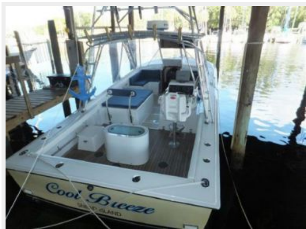
VIEW FROM STERN