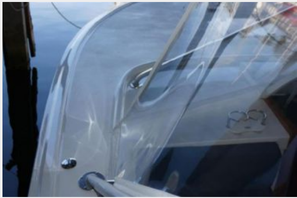
HIGH GLOSS PAINT