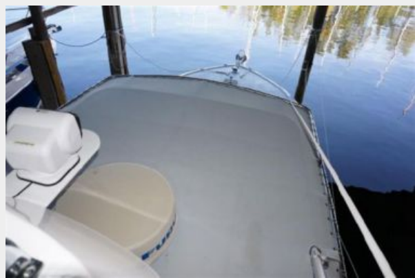
VIEW FORWARD FROM THE BRIDGE