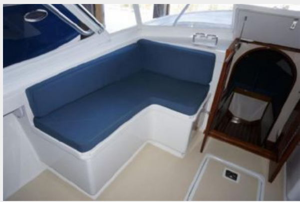
PORT FORWARD SEATING